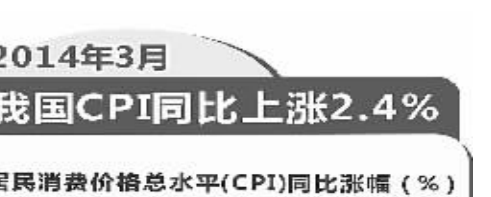
2014年3月 我国CPI同比上涨2.4%