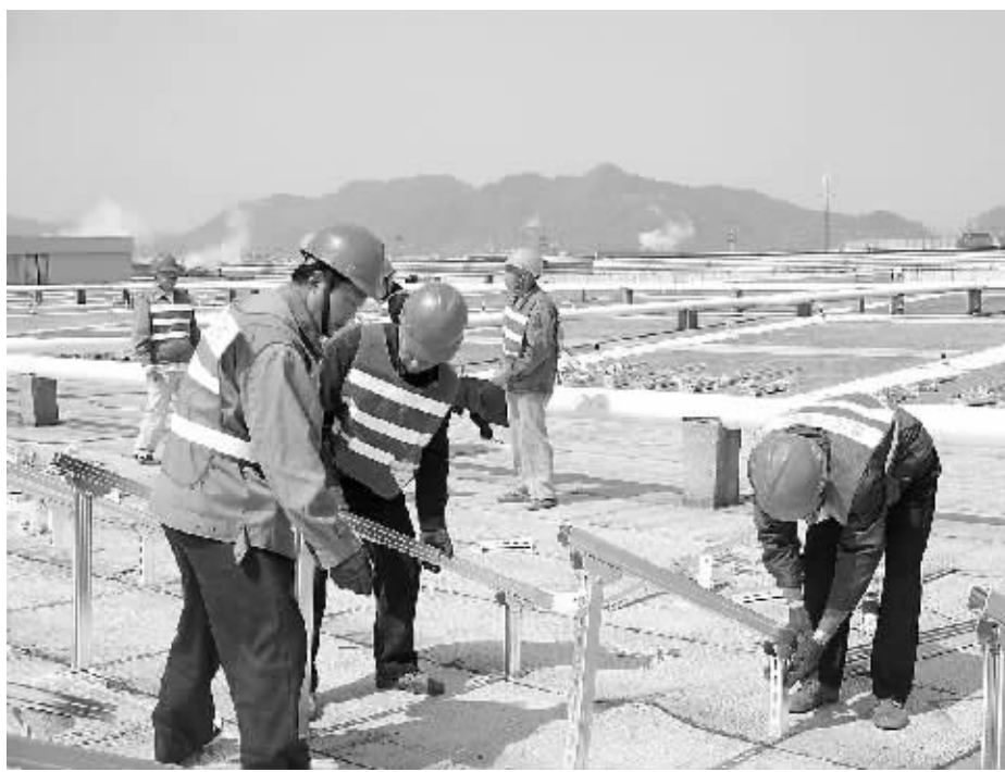
工人在申洲厂房屋顶安装光伏设备。