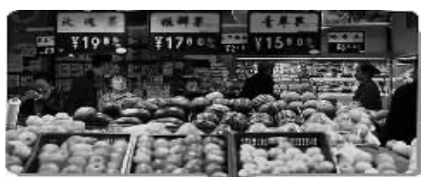
2014年3月 我国CPI同比上涨2.4%

王军认为，由于需求偏弱，全年CPI涨幅有可能控制在3%以内。价格不是突出矛盾，这增加了货币政策的回旋余地。一季度经济增速虽然会有所回落，但仍在合理区间，货币政策没有必要进行明显调整，但必要的政策储备还是要准备的。(据新华社)