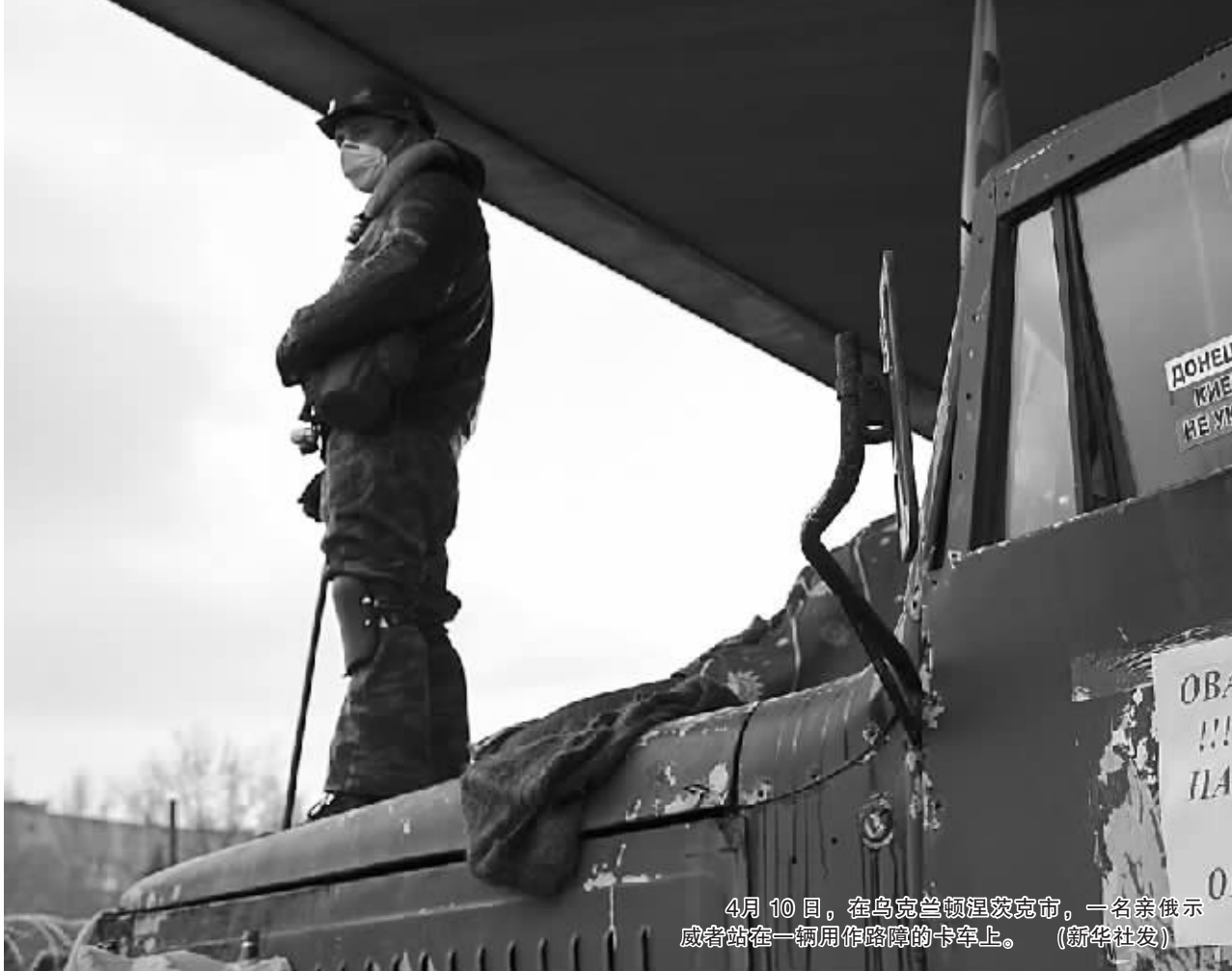
4月10日,在乌克兰顿涅茨克市,一名亲俄示威者站在一辆用作路障的卡车上。