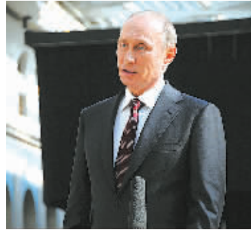
4月17日,在结束“与普京直接连线”电视节目后,普京与媒体见面。

据新华社莫斯科4月17日电(记者赵嫣)俄罗斯总统普京17日在莫斯科参加一年一度的“与普京直接连线”电视直播节目,用近4小时回答了国内民众提出的70多个问题。