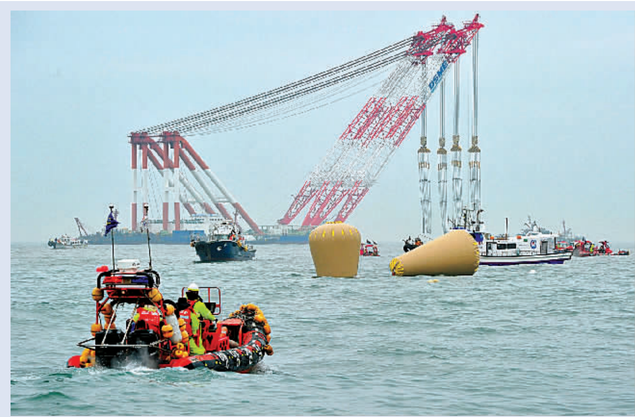
4月18日,在韩国珍岛附近海域,一架巨型海上起重机在标记“岁月”号失事客轮沉没地的浮标附近作业。

新华社供本报特稿(杜韵)尽管面临下雨、浪高、风急等不利因素,韩国搜救人员18日继续搜救“岁月”号客轮失踪人员。截至当天下午,官方确认的遇难人数上升至28人。