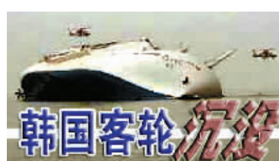
韩国客轮“岁月”号沉没