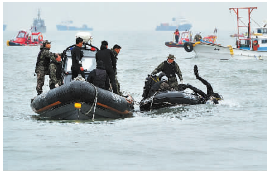
▲4月19日，在韩国全罗南道珍岛附近海域，救援人员在“岁月”号客轮沉没地点搜救。