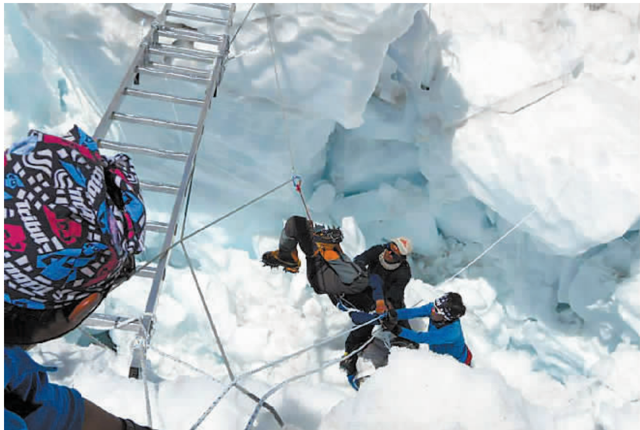
4月19日，在珠峰南坡，尼泊尔救援人员帮助一名幸存者离开雪崩现场。