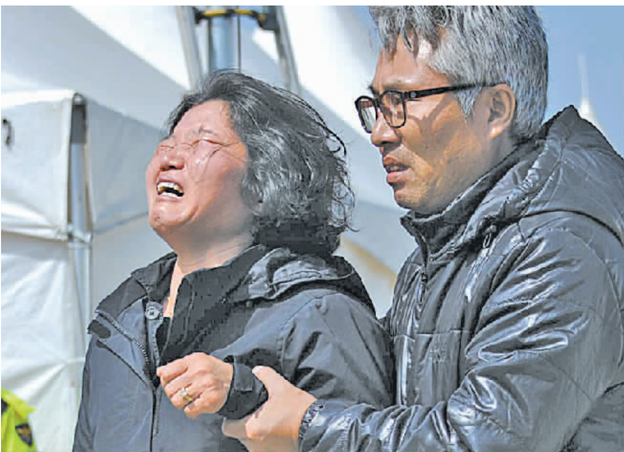
4月20日,在韩国珍岛,“岁月”号客轮沉没事故遇难者家属悲痛欲绝。

新华社供本报特稿(杜鹃) 韩国失事客轮“岁月”号的搜救工作20日进入第五天。潜水员前一晚进入船舱内并彻夜搜寻,打捞出十多具遇难者遗体。