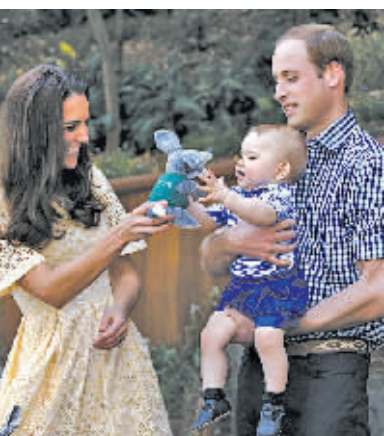
4月20日,在澳大利亚悉尼塔朗加动物园,英国小王子乔治抱着一只兔兔玩具。