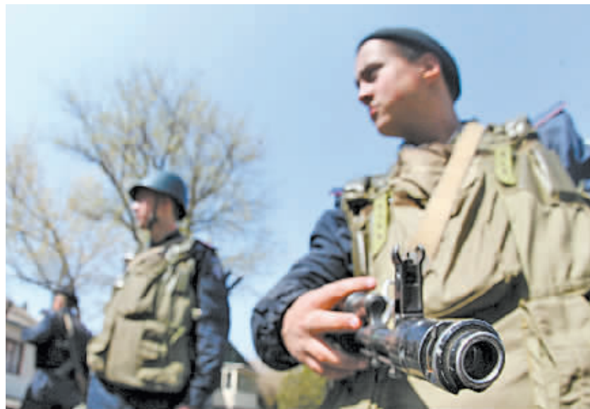
4月17日,在乌克兰顿涅茨克州马里乌波尔市,乌克兰警察在乌军事基地执勤。

他当天在基辅会晤欧洲安全与合作组织代表,后者将监督四方会谈落实情况。杰希察18日警告,如果亲俄武装今后几天不缴械和撤出政府建筑,政府在复活节过后将采取“更具实质性的行动”。