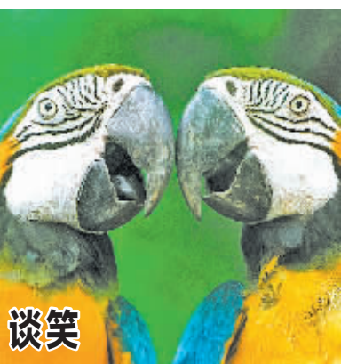
4月16日,两只蓝喉金剛鸚鵡在印度首都新德里的动物园里嘴碰嘴交流,宛若“谈笑风生”。

日本第四管区海上保安部当地时间19日下午5时30分许接到求救电话。电话称正在太平洋航行的7万多吨级的“亚洲帝国”汽车运输船发生火灾,船上11名韩国船员和13名菲律宾船员乘救生艇逃离货轮。 报道说,日本海上保安部门已派遣飞机和巡逻船赶往出事海域。