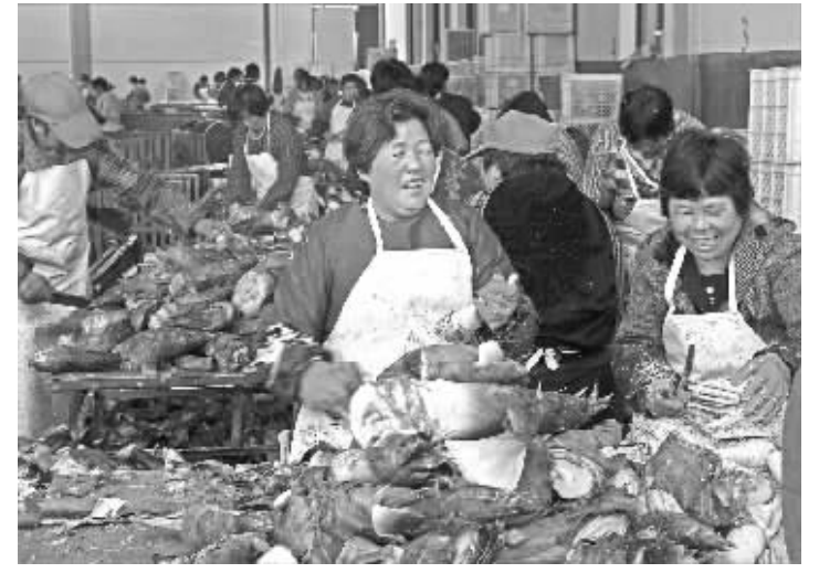
宁波是毛笋食品出口大市。图为我市毛笋加工企业,抓住毛笋上市季节,加大毛笋出口产品深加工力度。