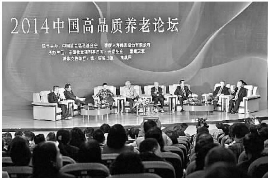
日前,在上海举办的高品质养老论坛上,与会专家就国内养老社区和保障的话题展开了热烈探讨。