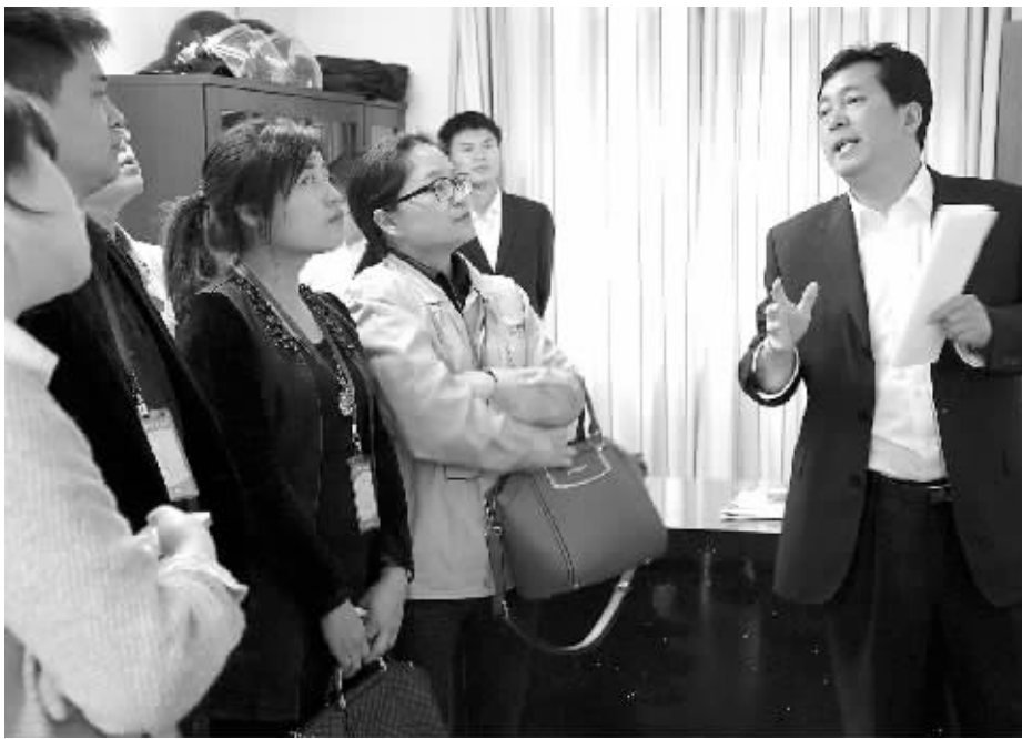
图为法官讲解诉讼流程。