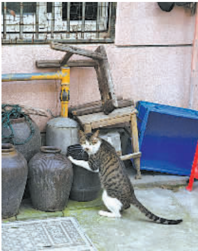
一只花猫在楼前溜达。

海文社区居委会的韩书记说,因为这些猫,106室与楼道里的11户居民关系日趋紧张。社区甚至请了辖区民警来做工作,也没效果。“我们查阅了很多资料,对养猫还真没什么规范文件,也没有哪个部门能来捉猫,实在头痛。”