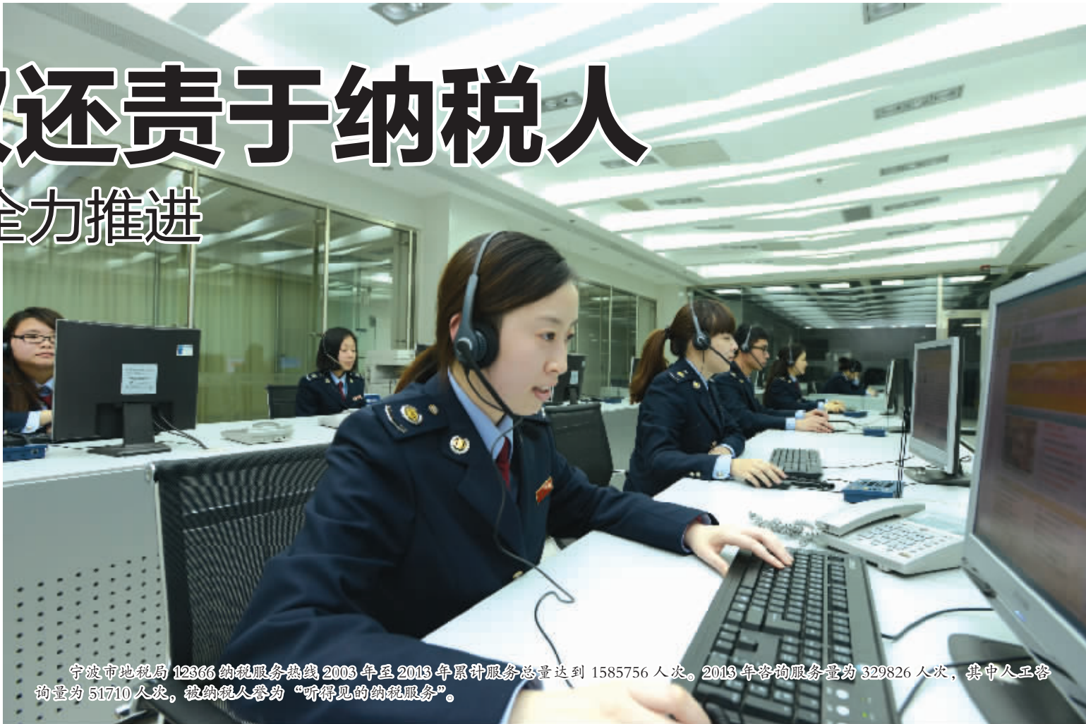
宁波市地税局12366纳税服务热线2003年至2013年累计服务总量达到1585756人次。2013年咨询服务量达329826人次，其中人工服务的量为51710人次，被纳税人誉为“听得见的纳税服务”。

核心提示： 宁波地税经历了20年不平凡的发展历程。20年来，依法行政不断推进，征管体系不断健全，征管方式不断创新，税收征管质量和效率明显提高，税收收入实现平稳较快增长。但近年来，随着经济社会化的快速发展，税收征纳关系发生了翻天覆地的变化，纳税人经历了从“执法客体”到“守法主体”的历史嬗变，依法治税观念日渐深入人心。因而顺应时代大势，推进税收征管改革成为必然的要求。宁波地税系统自我加压，牢固树立起税法遵从、公平公正和服务管理的理念，逐渐从前置审批转向后续管理，从“管理者”转变为“服务者”，充分还权还责于纳税人，让纳税人交明白税、便利税、满意税、诚信税，成为税收征管改革的方向和核心内容。