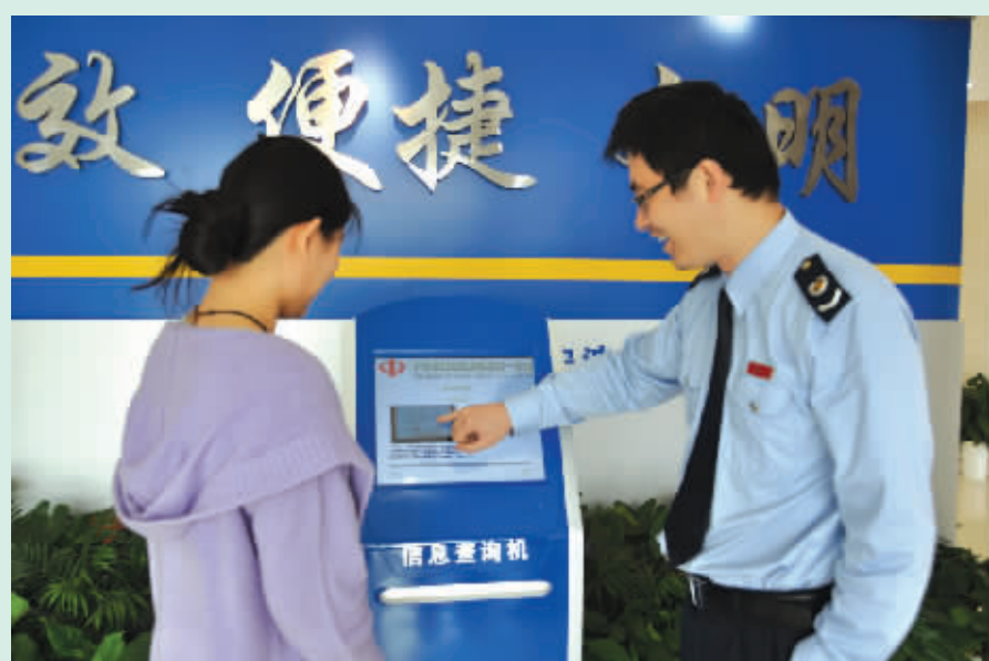
图为税务干部正在为纳税人辅导税收政策。