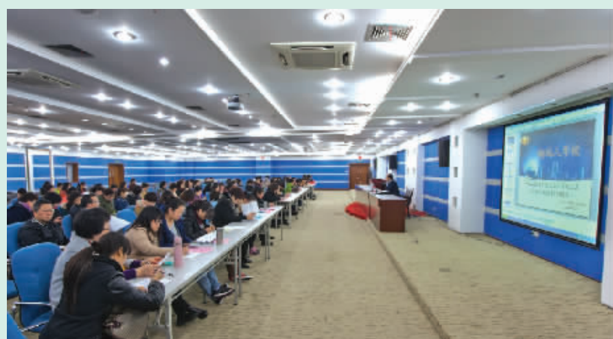
2014年4月，纳税人学校在全市地税系统普遍设立，学校免费为纳税人提供可持续的税法宣传和纳税辅导，图为税务干部正在为纳税人辅导建筑营业税政策。