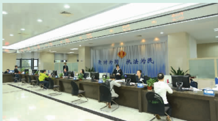
市地税系统目前有66个办税服务厅提供“一窗式”标准化办税服务，纳税人平均等候时间减少20%以上。