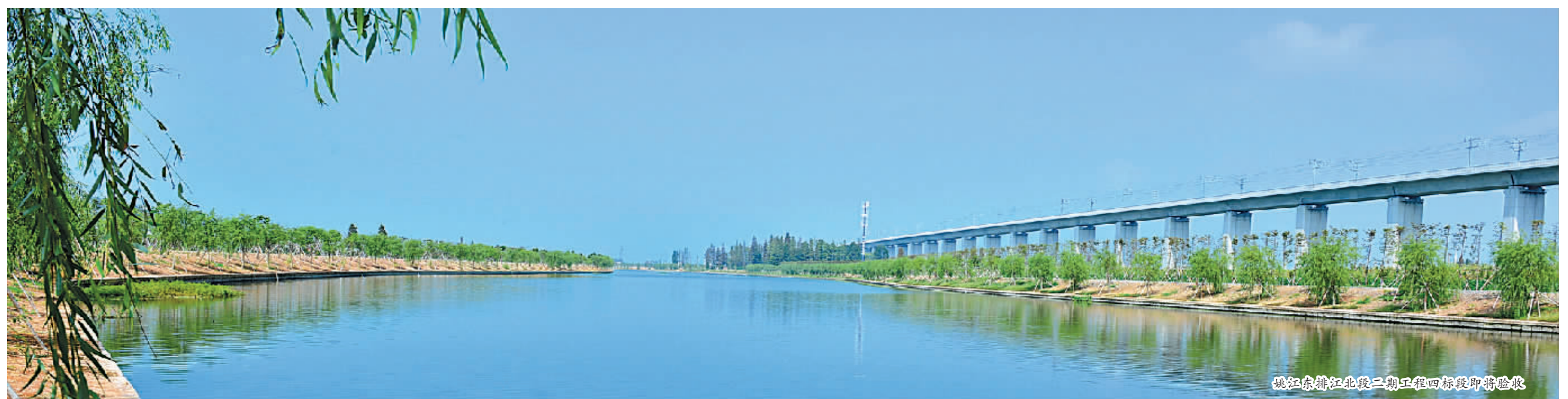
姚江东排江北段二期工程四标段即将验收