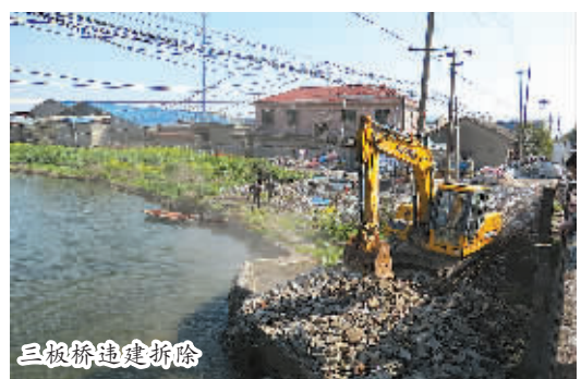
文字：宁波日报江北记者站