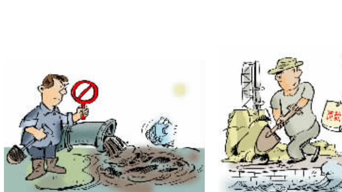
余姚江河道管理范围内不得新建、改建或者扩建排污口,其中在饮用水源保护区内的,禁止设置排污口。甬江、奉化江河道管理范围内严格控制设置排污口。

注:三江河道的管理范围为:两岸堤防之间的水域、沙洲、滩地(包括可耕地)、行洪区以及两岸堤防和保护堤地。(护堤地为堤防背水坡脚起向外延伸十米的地带;有护塘河的,以护塘河为界。)