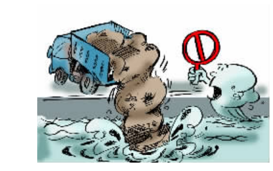
禁止在三江河道管理范围内倾倒或者排放渣土、泥浆、矿渣、石渣、煤灰、废砖、垃圾等废弃物。

注:三江河道的管理范围为:两岸堤防之间的水域、沙洲、滩地(包括可耕地)、行洪区以及两岸堤防和保护堤地。(护堤地为堤防背水坡脚起向外延伸十米的地带;有护塘河的,以护塘河为界。)