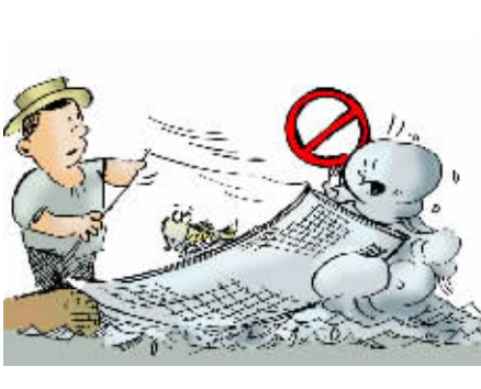
禁止在三江河道管理范围内设置阻碍行洪的拦河渔具;从事非法网箱养殖和利用电网、地笼、鱼箔等渔具进行捕鱼。