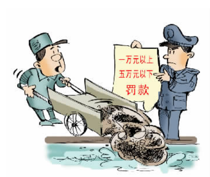
在三江河道管理范围内倾倒、排放渣土、泥浆、矿渣、石渣、煤灰、废砖、垃圾等废弃物的,责令停止违法行为,限期采取治理措施,恢复原状,处一万元以上五万元以下的罚款。