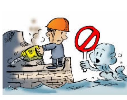
禁止在三江河道管理范围内从事采砂、取土、挖塘、打井、建窑等影响河势稳定、危害堤防安全的活动。