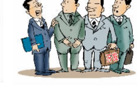
在三江河道管理范围内,开展水上旅游、水上经营、水上运动等开发利用活动,应当符合河道规划,不得影响防洪安全、污染水质、损害河道及其配套设施。有关行政主管部门在依法批准前,应当征求水行政主管部门的意见。