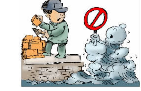
禁止在三江河道管理范围内堆放阻碍行洪或者影响堤防安全的物料;擅自修建围堤、阻水渠道、阻水道路。