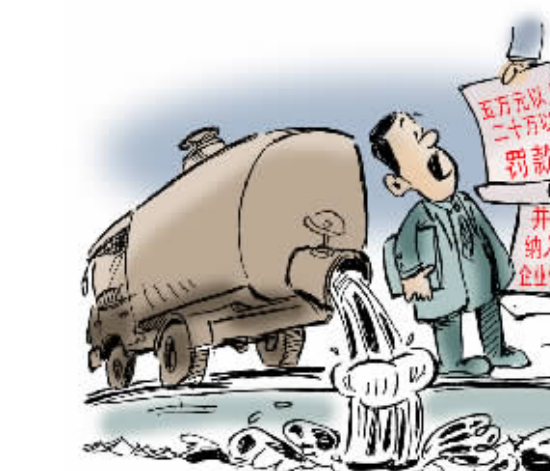
施工企业和从事相关废弃物清运的经营服务企业在三江河道管理范围内倾倒、排放渣土、泥浆、矿渣、石渣、煤灰、废砖、垃圾等废弃物的,造成河道安全隐患或者破坏或者河道淤积堵塞的,责令停止违法行为,限期采取治理措施,恢复原状,处五万元以上二十万元以下的罚款,并将违法信息予以公告后纳入各级政府的信用信息数据库。