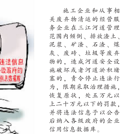
施工企业和从事相关废弃物清运的经营服务企业在三江河道管理范围内倾倒、排放渣土、泥浆、矿渣、石渣、煤灰、废砖、垃圾等废弃物的,造成河道安全隐患或者破坏或者河道淤积堵塞的,责令停止违法行为,限期采取治理措施,恢复原状,处五万元以上二十万元以下的罚款,并将违法信息予以公告后纳入各级政府的信用信息数据库。