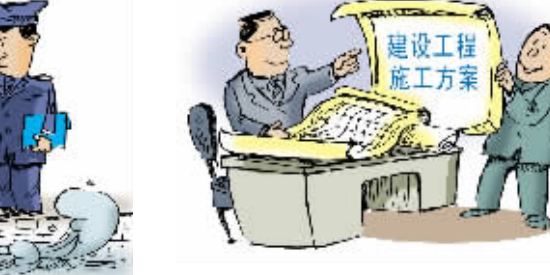
三江河道管理范围内的建设工程开工前,施工单位应当将施工方案报沿江有关区(市)水行政主管部门备案。因施工需要临时筑坝围堰、开挖堤坝、管道穿越堤坝、修建阻水便道便桥的,应当事先报经沿江有关区(市)水行政主管部门依法批准。