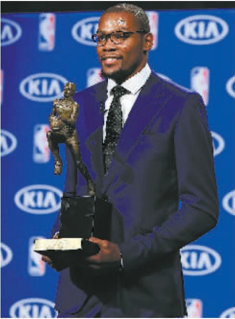
5月6日，杜兰特在俄克拉荷马城举行的新闻发布会上手捧 MVP 奖杯。