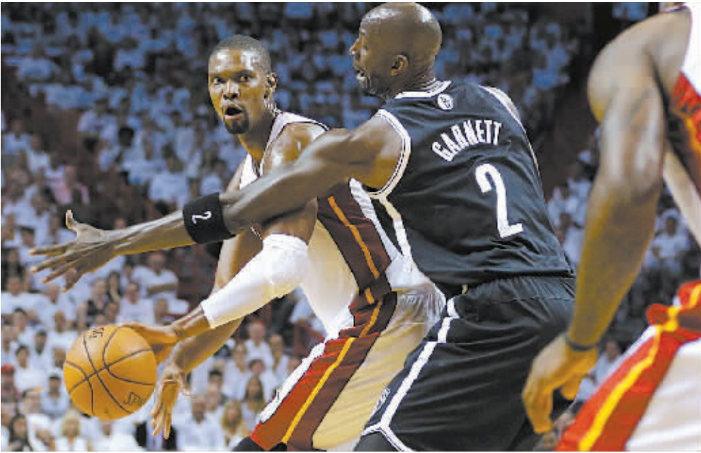
5月6日，热火队球员波什（左）在比赛中带球突破。

韦斯特布鲁克本赛季因伤长期缺阵,其间杜兰特场均得到35分和6.3次助攻的惊人表现带领球队打出20胜7负的战绩,让球队战绩始终坚挺。