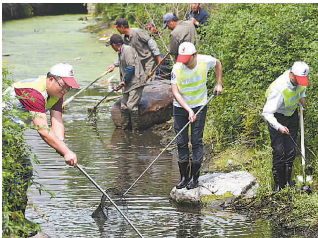
昨天,镇海城管局骆驼中队组织来自明欣建设有限公司等单位的20名城管义工与静远社区居民一起,对路兴家园的景观河道进行清理,以净化景观河水生态环境。