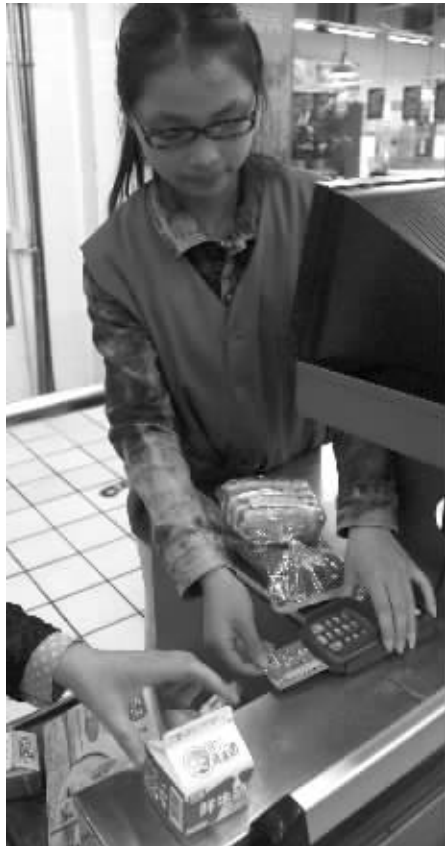
市民卡支付的“小额性”,为消费上紧了安全阀门。

到2016年,在大交通领域,我市将配套完成大市区公交车、轨道交通、出租车、公共自行车、咪表、区间巴士和有轨交通刷卡应用,实现市区公立公共停车场市民卡可刷卡覆盖率不低于50%,初步完成大交通应用的整合。