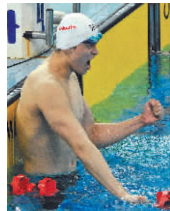
5月12日晚,浙江队选手孙杨庆祝夺冠。

据新华社青岛5月12日电(记者张旭东 苏斌)2014年全国游泳冠军赛暨亚运会选拔赛12日在青岛开赛,奥运冠军孙杨在率先进行的男子200米自由泳预赛赛中,取得了1分47秒69的预赛最好成绩。他在男子200米自由泳决赛中以1分46秒04夺冠,这个成绩可以排在今年世界第五,比韩国名将朴泰桓的今年最好成绩快了0.01秒。