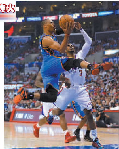
5月11日,快船队球员克里斯·保罗(右)在比赛中防守雷霆队球员威斯布鲁克。

据新华社华盛顿5月11日电 NBA季后赛11日的主旋律是“大逆转”,印第安纳步行者队和洛杉矶快船队在大比分落后的逆境下上演了后来居上的好戏。