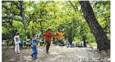
(记者 金雅男 王珏 整理)