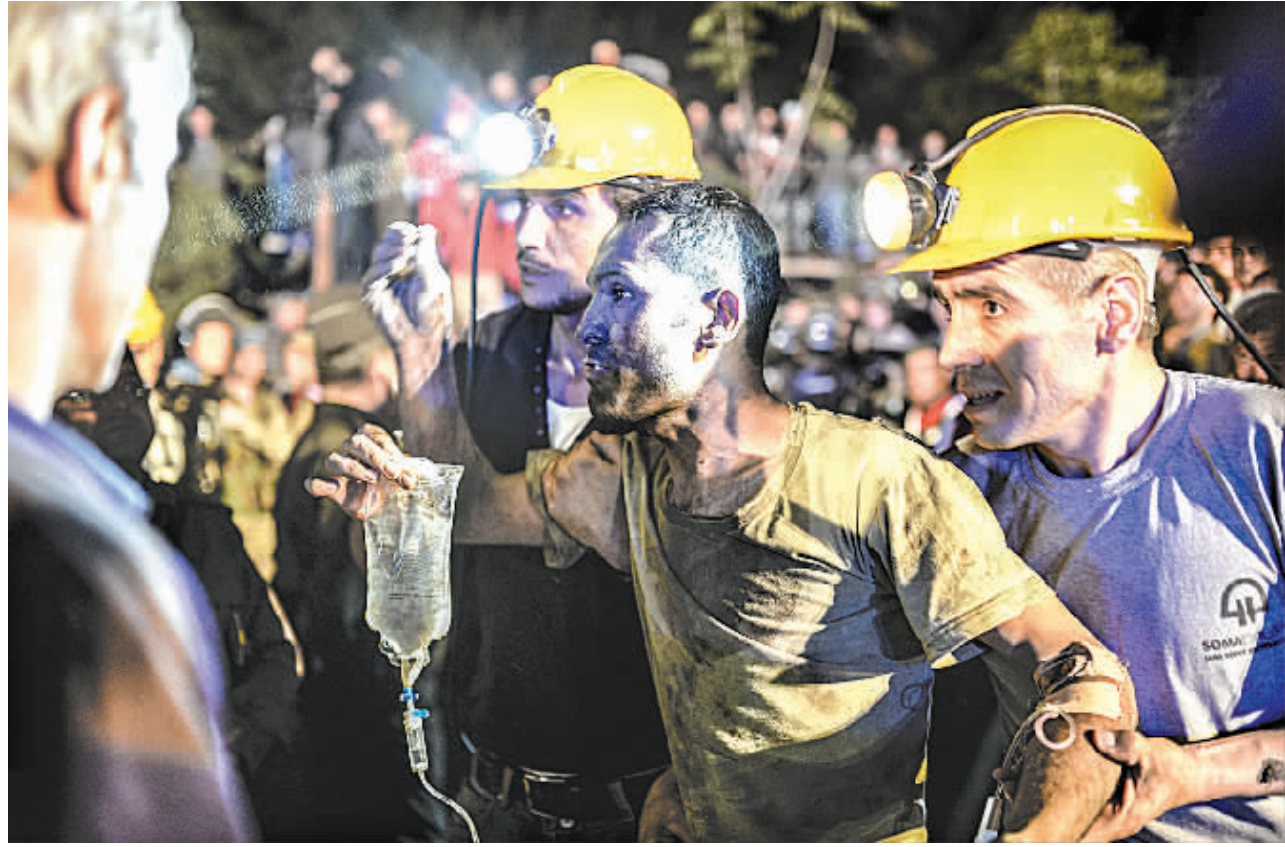
5月13日，在土耳其西部马尼萨省索马地区，救援人员搀扶一名受伤的矿工离开事故现场。

由于安全条件普遍较差，近年来土耳其煤矿事故频发。2013年1月，土耳其西北部宗古尔达克省发生煤矿瓦斯爆炸事故，造成8人死亡。1992年，宗古尔达克省一座矿井曾发生爆炸，造成263人死亡。