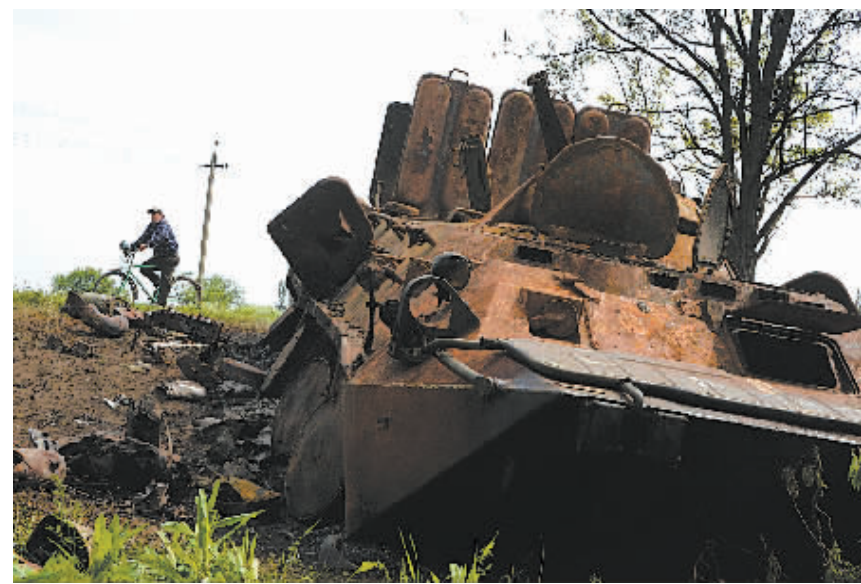
5月14日，在乌克兰东部顿涅茨克州克拉马托尔斯克市附近的一个村庄，一名男子骑车从被损毁的乌克兰军队装甲车旁经过。

纽兰在访问爱沙尼亚时举行新闻发布会说：“我们看到，卢布对美国贬值了约20%，我们看到俄罗斯债券评级在