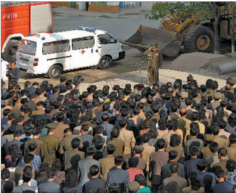
5月17日,在朝鲜平壤,一名官员在事故现场向市民表示慰问和道歉。

新华社本埠特稿(胡若愚) 朝鲜官方媒体 18 日罕见地报道一起上周发生在首都平壤的“严重”事故:一座在建高层公寓楼坍塌,造成人员伤亡;多名高级官员则罕见地面对民众公开道歉。