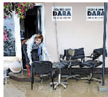
5月17日,在波黑塞族共和国首府巴尼亚卢卡,一名妇女试图挽救办公室内的家具。

波黑近日连降大雨,河水水位暴涨,引发山体滑坡和该地区 100 多年来最严重的洪灾。波黑警方和救援部门 17 日说,洪灾已经造成至少 19 人死亡,上万人被迫转移,数百栋建筑损毁严重。