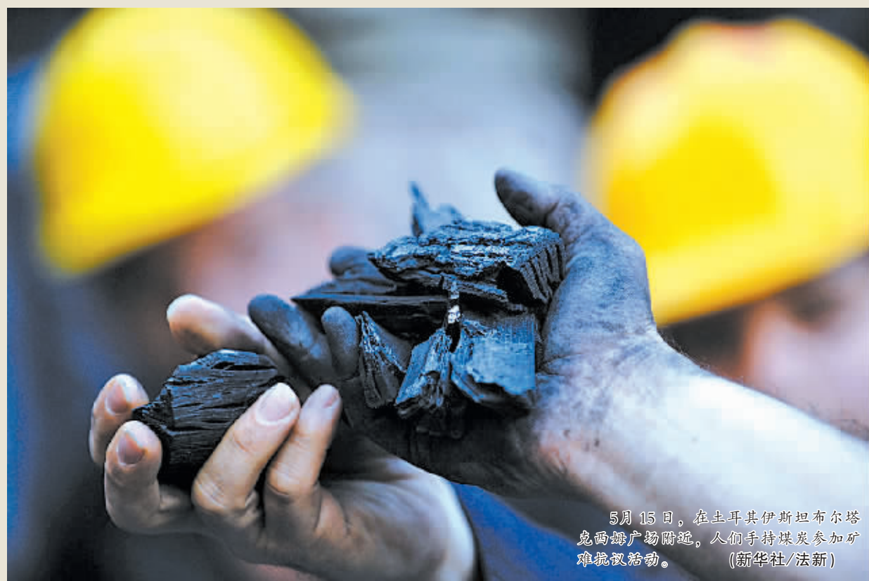
5月15日,在土耳其伊斯坦布尔塔克西姆广场附近,人们手持煤炭参加矿难纪念活动。

新华社专电 土耳其媒体 18 日报道,作为对索马矿难调查的一部分,警方拘留 18 人,包括多名煤矿公司主管。