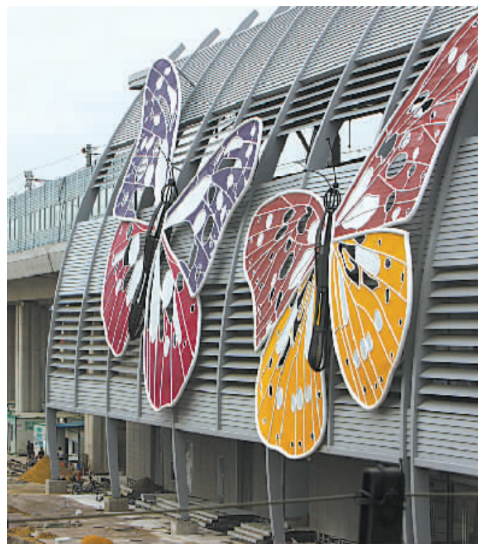
地铁梁祝站文化墙。