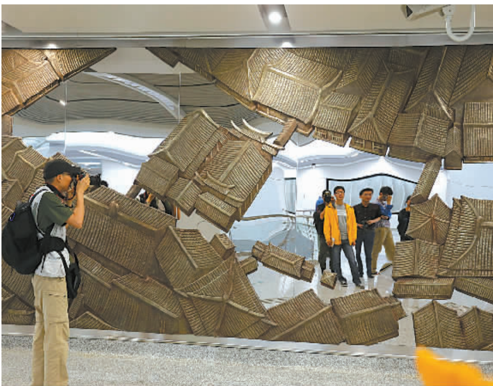
地铁鼓楼站文化墙。

该站是1号线一期的终点站，连接车辆段与轨道交通控制中心。车站主体位于宁穿路与浦港路丁字路口，车站跨浦港路东西向设置。车站周边以2、3层民居及临时建筑为主。本站为地下二层11米岛式带出入段线车站。