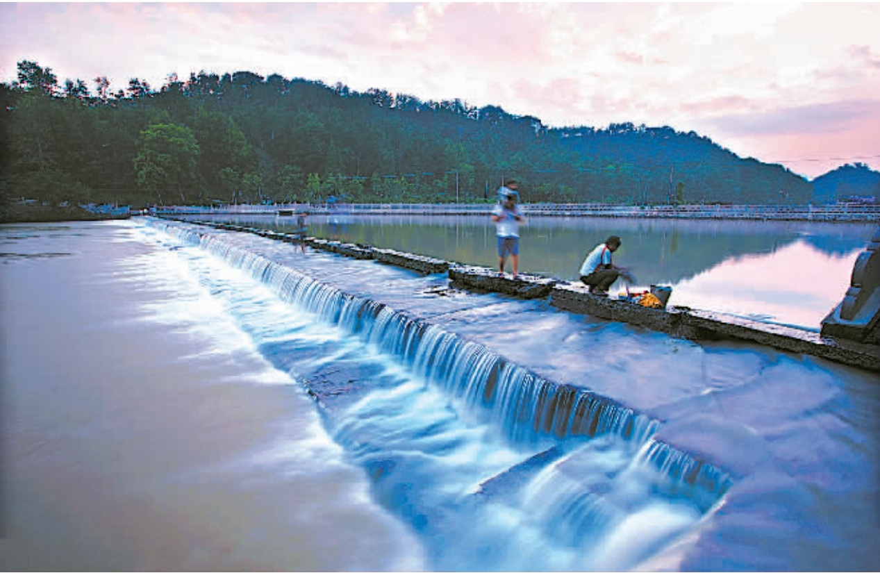
位于鄞州的中国古代四大水利工程之一——它山堰

运行,滨海污水处理厂要完成扩容;建成污水主干管和收集管网78公里,并分模式、分类型推进农村生活污水设施建设,全面提升农村生活污水治理水平。 今年,鄞州在抓好生活污水、全力以赴清“三河”、疏通河道活“一络”的同时,还依托快马加鞭推进工程“防洪水”,统筹推进奉化江、姚江、大嵩江等重大城市堤防工程,重点推进鄞东南沿山干河工程,提速重点小流域整治,水库维修加固、屋顶山塘整治等,完善设施“排涝水”,加快沿河强排闸和强排泵站建设,完善防洪排涝规划,落实相应的举措。改善生态“保供水”,多措并举“抓节水”,切实做好每一项事关“五水共治”,事关民生福祉的事情。