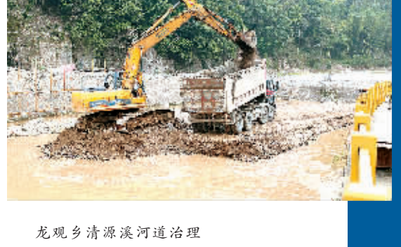
龙观乡清源溪河道治理