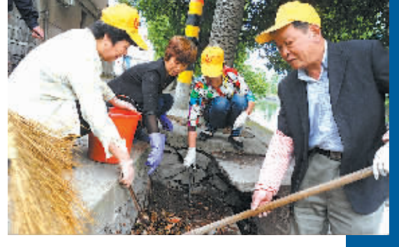
石碛街道联丰村护河志愿者