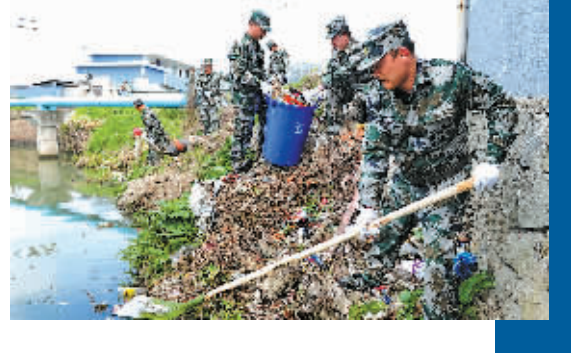
五乡镇组织民兵清理河道