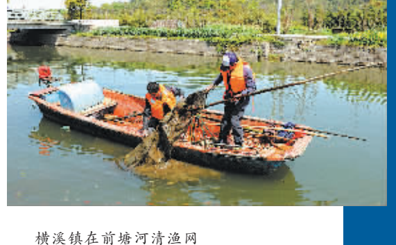
横溪镇在前塘河清淤河