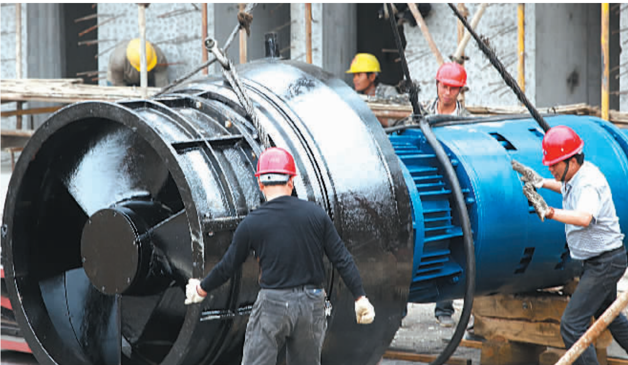
昨天，镇海区新泓口排涝泵站工地，施工人员在吊装泵站主机。该“东排”项目是市防汛治涝重点工程，计划总投资近 1 亿元，也是五大水利应急工程率先安装动力机组的。该工程将在今年汛期到来前投入使用。