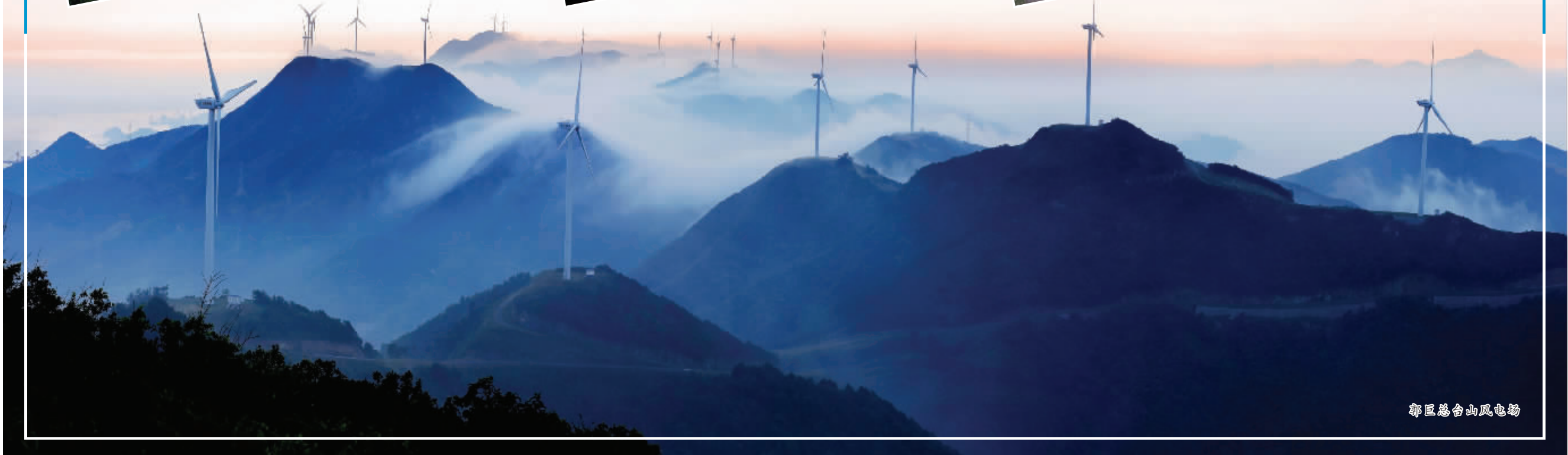
鄞区总台山风电场