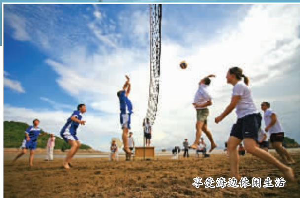
享受路边休闲生活