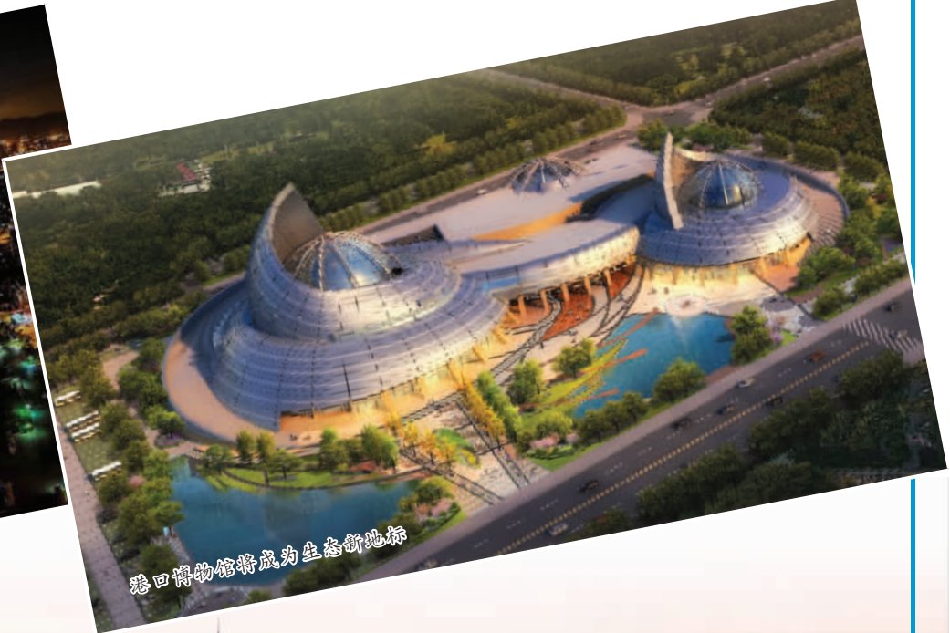
港口博物馆将成为生态新地标