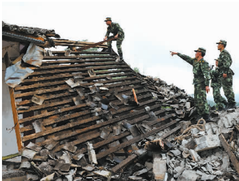
5月24日，救援人员在卡场镇吾排村清理景颇族村民勇巴麻家被毁的房屋。

据新华社昆明5月24日电(记者侯文坤)记者从云南省民政厅获悉，当天4时49分发生在盈江县境内的5.6级地震，截至14时，地震已造成13人轻伤，震中区民房倒塌、损坏9688间，36所学校不同程度受损，31.1万人不同程度受灾。受伤人员均已送往医院救治，救援工作正在紧张进行中。