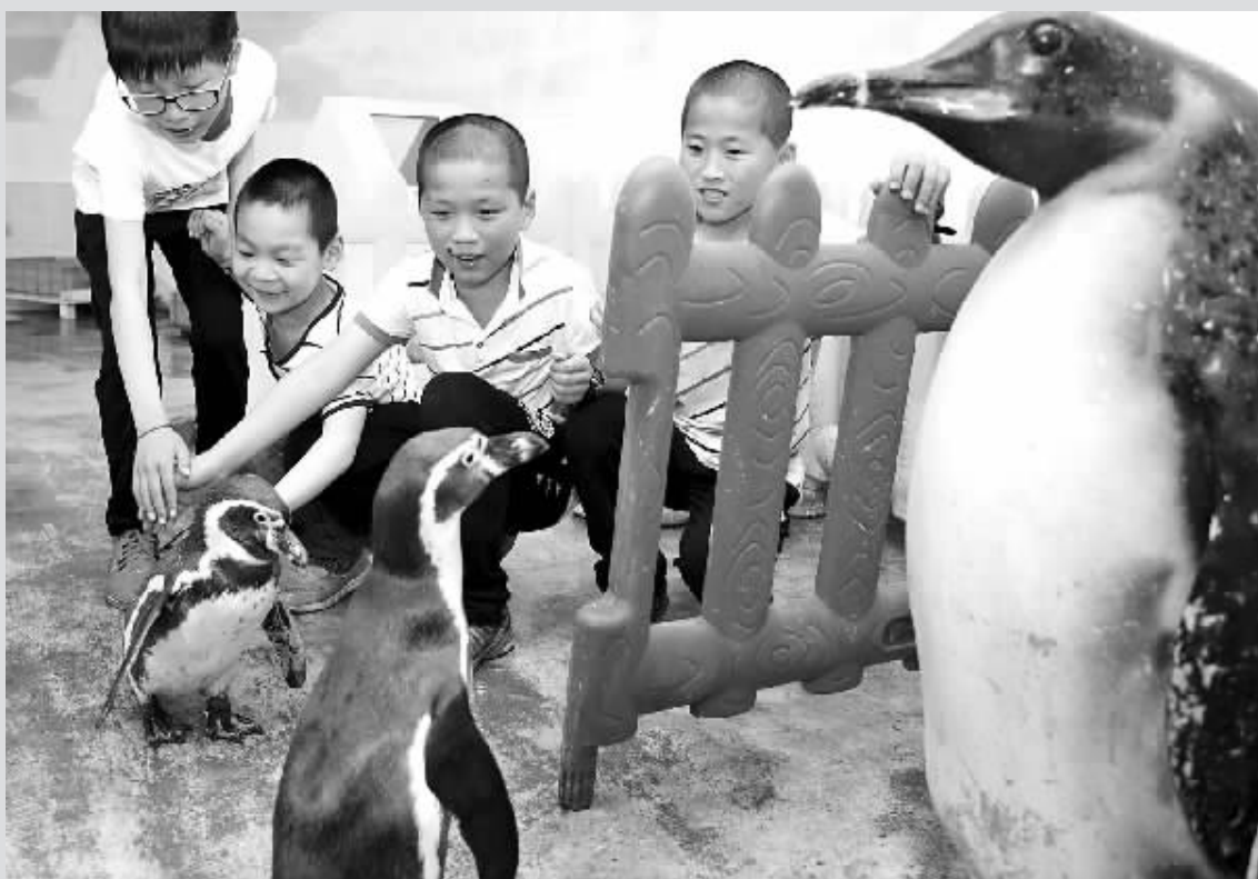
昨天，市公交总公司永安分公司30多名“公交娃”参观宁波海洋世界，与在宁波出生的小企鹅玩耍。近日，海洋世界负责人得知30多名公交司机制节假日要坚守岗位，不能陪孩子过节，于是邀请他们的孩子儿童节前来海洋世界体验。