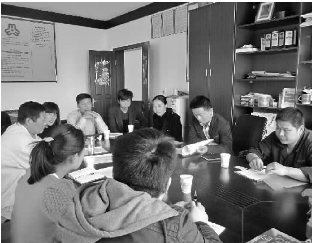
宁海县商会企业服务中心工作人员，正在一家企业与员工展开劳动和谐关系座谈会。

因为创立之初还不十分明确具体的市场定位，宁海县商会企业服务中心一开始也走过弯路。童跃告诉记者，当时想以会员制来服务企业，针对VIP企业提出来的需求，中心提供保