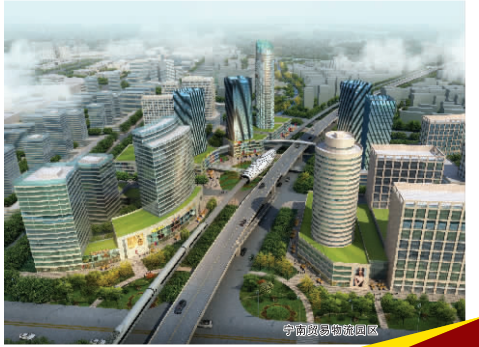
文/奉化市新闻办