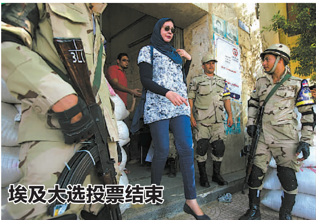
埃及大选投票结束

不少国际投资人士表示,这是越南近二十年来针对外国企业最严重的暴力破坏活动,这将极大损害越南的国际投资形象。美国传统基金会高级研究员成斌表示,暴力活动可能会大大降低越南作为投资目的地的受欢迎程度。