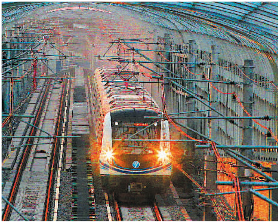
昨晚，列车在1号线一期工程高架段作开通前的最后试运行。

次年，轨道交通线网规划跃上图纸。按照当时宁波的经济发展水平和人口集聚水平，规划方案以“跨三江、连三片、沿三轴”构成了“三主三辅”6条线，总长247.5公里。【下转第20版】