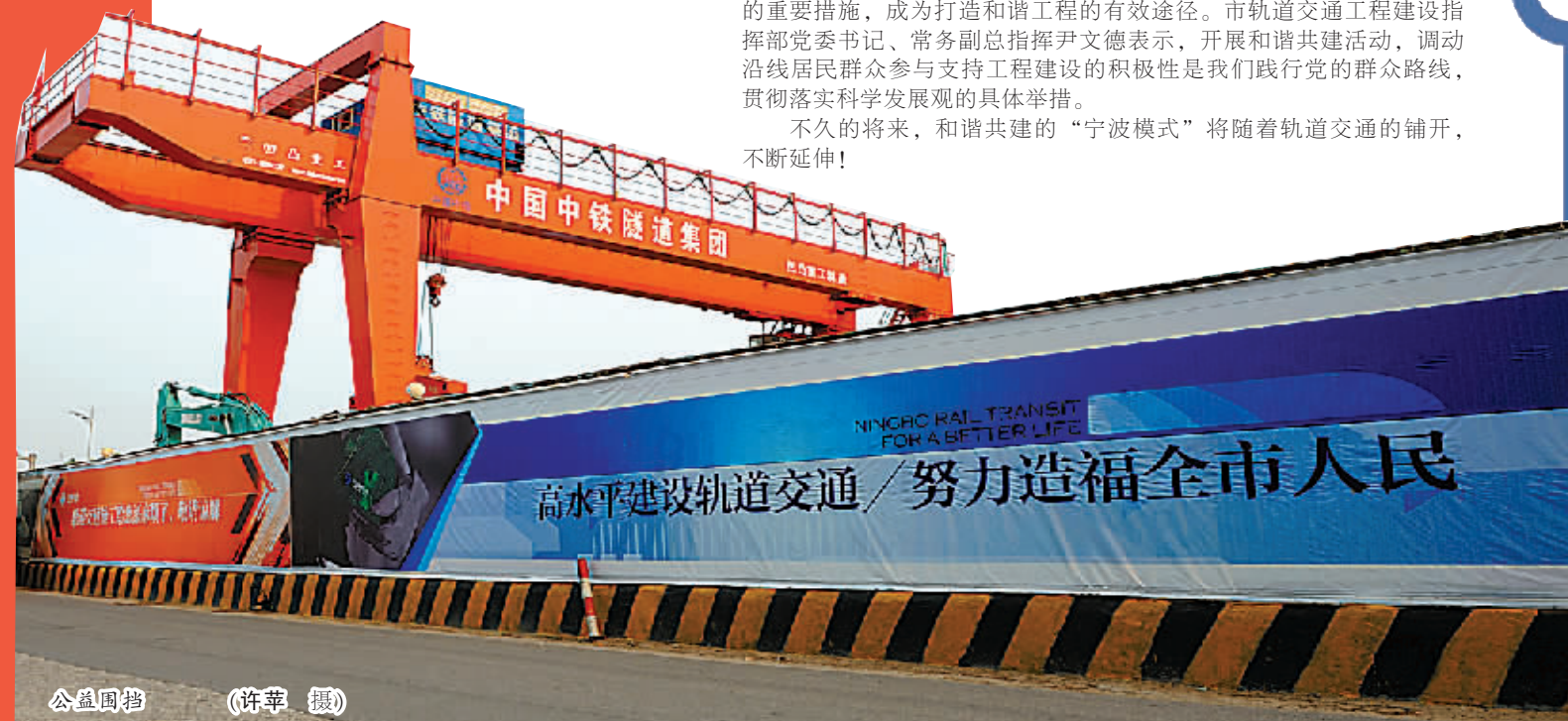
公益围挡