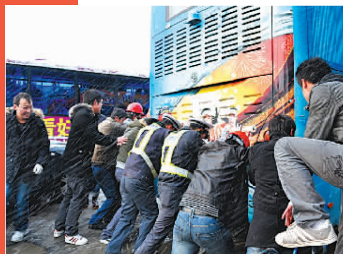
1号线I标项目部员工冒风雪帮助过路车辆通行