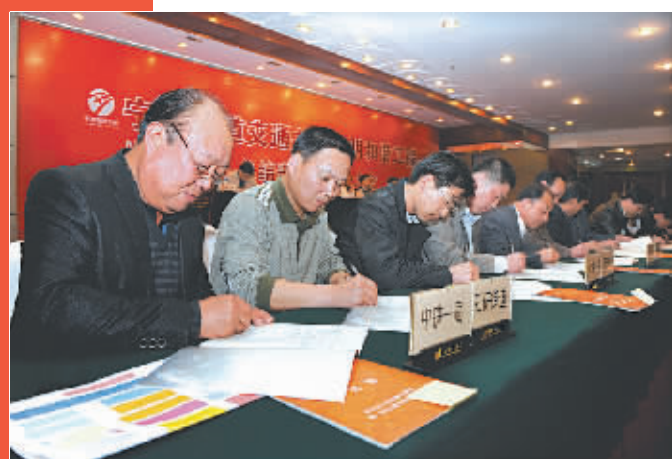
指挥部集团公司组织施工单位与社区（村）签订结对共建协议书