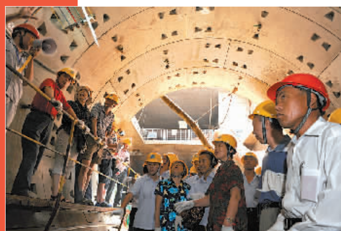
市民代表参观轨道交通工地