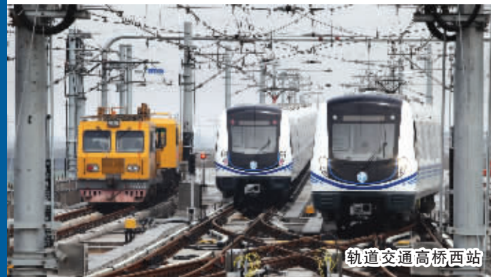
轨道交通高桥西站