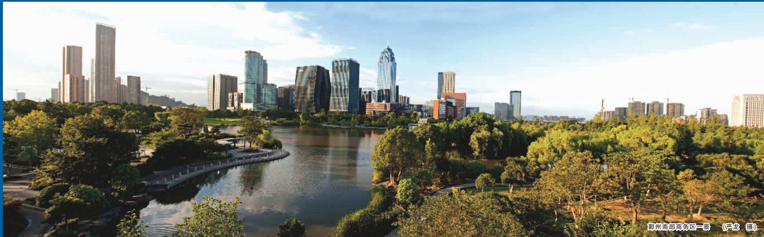
鄞州南部商务区一景