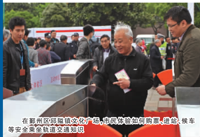
在鄞州区邱隘镇文化广场，市民体验如何购票、进站、候车等安全乘坐轨道交通知识