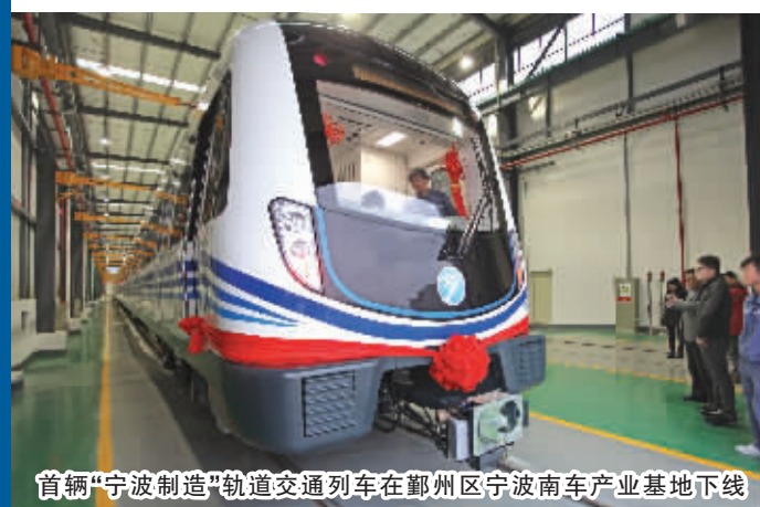
首辆“宁波制造”轨道交通列车在鄞州区宁波南车产业基地下线

随着轨道交通的开通，鄞州也迎来了城市发展难得的历史机遇。相比于地面公共交通，轨道交通可以为市民提供更高效、优质的出行服务；城市空间沿着轨道呈“多中心”格局聚集发展，必将对鄞州的城市发展格局产生深远的影响。