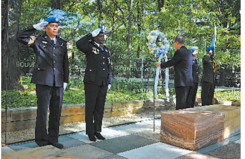
今年5月29日是第12个国际维和人员日。联合国当天在纽约总部举行纪念活动，缅怀和表彰在联合国维和行动中殉职的维和人员。图为联合国秘书长潘基文(右三)昨天在纪念活动上敬献花圈，缅怀在联合国维和行动中殉职的维和人员。

新华社本埠特稿 联合国负责维和行动的副秘书长埃尔夫·拉德苏(中文名为苏和)本月29日说，目前中国参与了联合国在世界各地展开的10项维和行动，参与维和行动的数量居联合国安理会五个常任理事国之首。