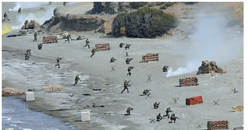
5月29日，土耳其士兵在土西南部伊兹密尔的安伊海湾附近参加海陆空联合军事演习。

来自土耳其陆海空三军的约8500名士兵参加了本次演习。演习旨在检验土耳其应对包括恐怖袭击、地区民族冲突和有组织犯罪在内的非传统安全威胁的能力。