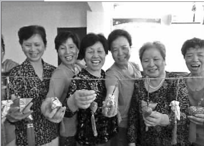
昨日,江东常青藤社区举行“邻里和谐香袋”活动。图为比赛现场。

本报(记者王路)记者从本市文化部门了解到:端午节期间,我市各地安排了丰富多彩的民俗活动,邀请市民品味端午传统,了解宁波地域文化。