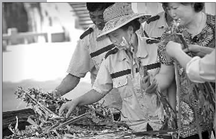
在南塘老街举办的“端午民俗会”上,市民免费领取艾草菖蒲。