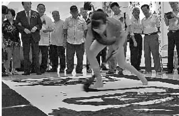
图为展览现场。

据悉,“大道逍遥一胡朝霞书法篆刻艺术展”在中华艺术中心展出,展览将在6月4日结束。