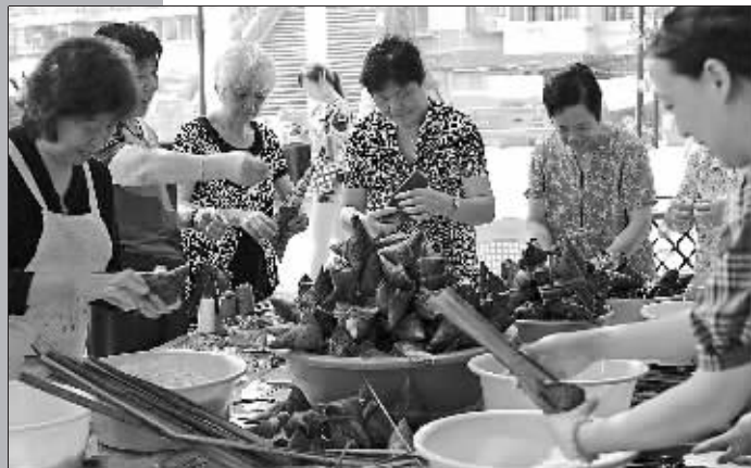
5月29日,海曙区南门街道红起社区居民开展传统包粽子活动。