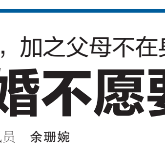
争抚养权成为必然。司法要平复当事人的心灵创伤。

不仅对村里的山光水色流连忘返,还喜欢上了村里原汁原味的乡土典藏。“乡村记忆示范基地”不仅仅是一个拥有多种形式元素的档案文化阵地,也是一个集档案文化、历史传承、旅游资源于一体的教育基地;不仅能够丰富百姓的文化生活、提升乡村的文化品位,也能带动乡村第三产业的发展。