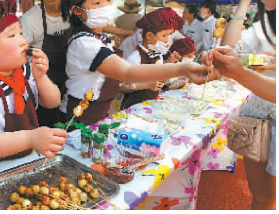
宁波市达敏学校学生艺术节暨美食节近日开幕。近百名智障学生成为11个美食台小主人,他们用爱心单位提供的食材做成果汁、汤圆、三明治等,以此展示生活技能。