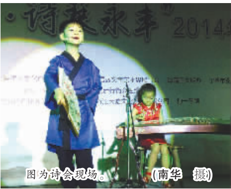
图为诗会现场。

本报讯 (记者南华 海曙记者站朱尹莹) “节分端午自谁言，万古传闻为屈原”。昨晚，琴声袅袅、灯影婆娑，“风雅鼓楼·诗琴永丰”2014端午诗会在鼓楼永丰库遗址上举行，这是我市近年来第一次以诗赋琴乐的形式来追忆爱国诗人屈原的大型开放性端午诗会。诗会由海曙区委宣传部、海曙区文广新局、海曙区文联和区图书馆联合主办。