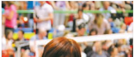
6月1日，中国女排主教练郎平在比赛中略显无奈。

素有“小世界杯”之称的2014年瑞士女排精英赛1日在瑞士蒙特勒落幕，郎平率领的中国女排在三、四名决赛中遭俄罗斯逆转，无缘季军。郎平在赛后接受新华社记者采访时表示，中国队在本次比赛中总体“打得不错”，但有机会抓不到，不是运气不好，反映出年轻球员在拦网、小球串联与技术细腻程度方面的不足。