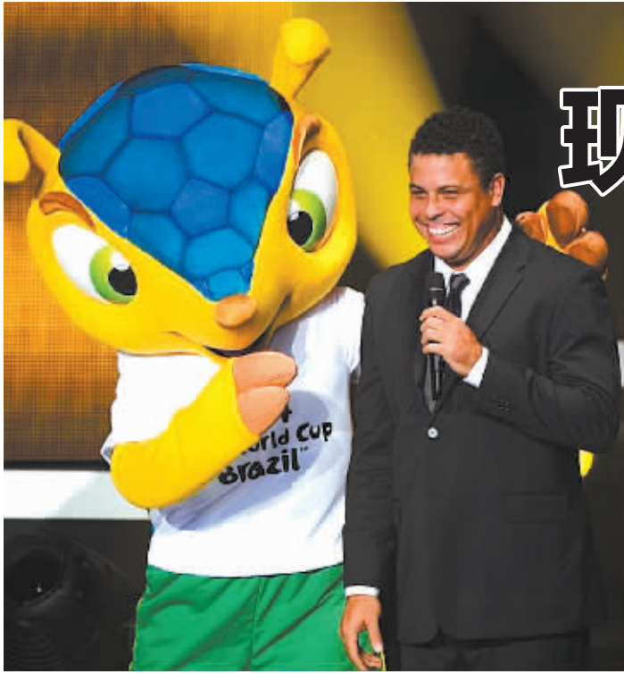
罗纳尔多与巴西世界杯吉祥物。

在距离2014年巴西世界杯揭幕仅剩10天之际,电视转播中频道IBC开张营业,国际足联宣布再播放18万张门票,32支参赛球队的大名单已基本尘埃落定。