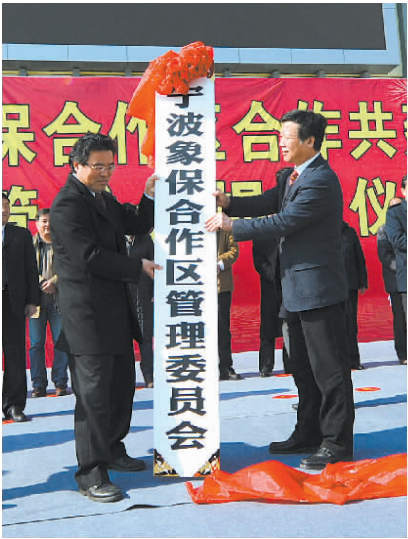
▲2013年12月22日宁波象保合作区管委会揭牌

“六大工程”逐步展开。根据“三年出形象”总体要求和今年浙洽会启动区基础设施项目正式开工的目标，有关工程项目正按计划快速推进。今年计划投资12.6亿元，其中土地投资7.6亿元，基本建设5亿元，主要包括启动区基础设施、综合保税区、生产力中心、机器人产业园、商务生活配套区、围海造地等六大工