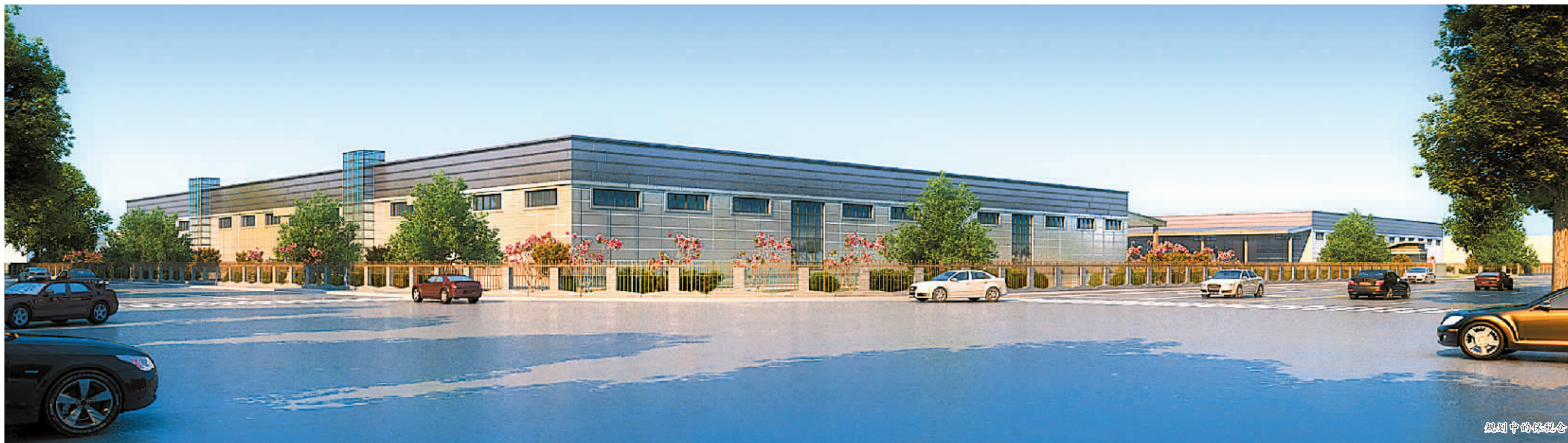
规划中的保税制造