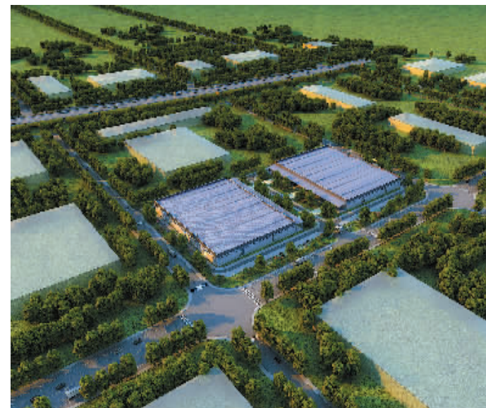
▲规划中的保税制造鸟瞰图

秉承宁波保税区“小政府、大社会”理念，实行大部制，人员机构精简、职能完整、结构合理、运行高效，具有“招商、稳商、亲商、富商”的浓厚意识。建立一套办理解决、探索“无费商”、“零审批”管理模式和综合执法改革，职能部门和专业服务机构为投资者提供系统化、专业化、精细化的全过程、全方位、全免费服务。