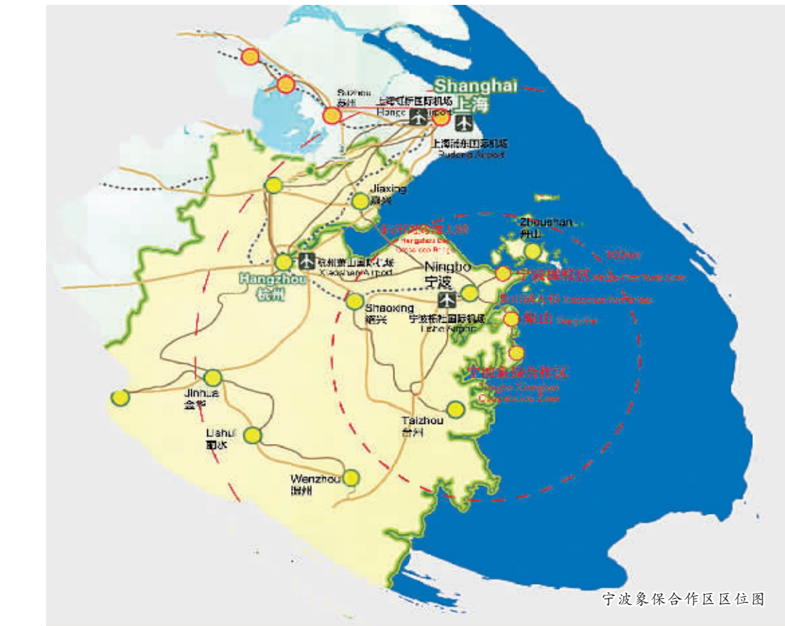
宁波象保合作区区位图

未来合作区将积极打造“一区四园二中心”。“一区”即宁波象山综合保税区，规划面积1平方公里，中报方案已上报国务院，目前正在审批中。2万平方米保税仓年内将开工建设。综合保税区享有“免视、免证、保税”等特殊功能政策优势，是我国实行政策功能创新的对外开放平台，将借鉴上海自贸区相关经验，推进相关制度创新及政策创新。 “四园”即四大产业园。一是机器人产业园，规划建设“一平台三基地”，即机器人产业研发平台和机器人产业基地、海洋高端装备基地、智能制造装备基地。一期规划建设面积20万平方米，今年启动5万平方米标准厂房，计划12月底前完成方案设计、施工图设计和施工招标，明年1月开工。二是航天科工产业园，规划建设3平方公里，与中国航天科工集团合作，由航天建设集团建设，重点发展航天科技、航天装备、航天信息产业。三是侨商产业园，规划面积2平方公里，由宁波市侨商会为主投资，搭建侨商创业投资平台，打造集创业、产业、科研、文化、商贸为一体的综合性产业园区。四是养生健康产业园，充分利用象山临海、环境优美、空气清新、周边旅游资源丰富等优势，开发建设养生养老地产项目，引进、做大、做强健康产业。 “二中心”分别为“机床设备交易中心”，已经与中国机床设备进出口协会及业内相关企业对接，拟建设占地100亩的国内外机床设备交易市场，组织开展专业展示交易，以及培训、安装、测试、维修等服务，促进贸易项目聚集和相关生产配套项目落户。“进口商品展示交易中心”，由亚洲阳光海城投资公司投资，占地1000亩，其中一期占地600亩，总投资10亿美元，包括全球特优商品商贸中心、亚洲海港大酒店、亚洲阳光酒店公寓、海阳国际海鲜城、环球进口食品、水果冷链批发中心、中国梦之旅主题公园。