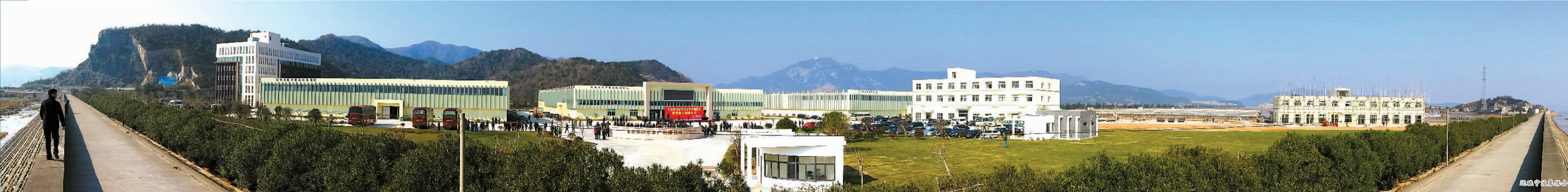
鸟瞰宁波象保合作区