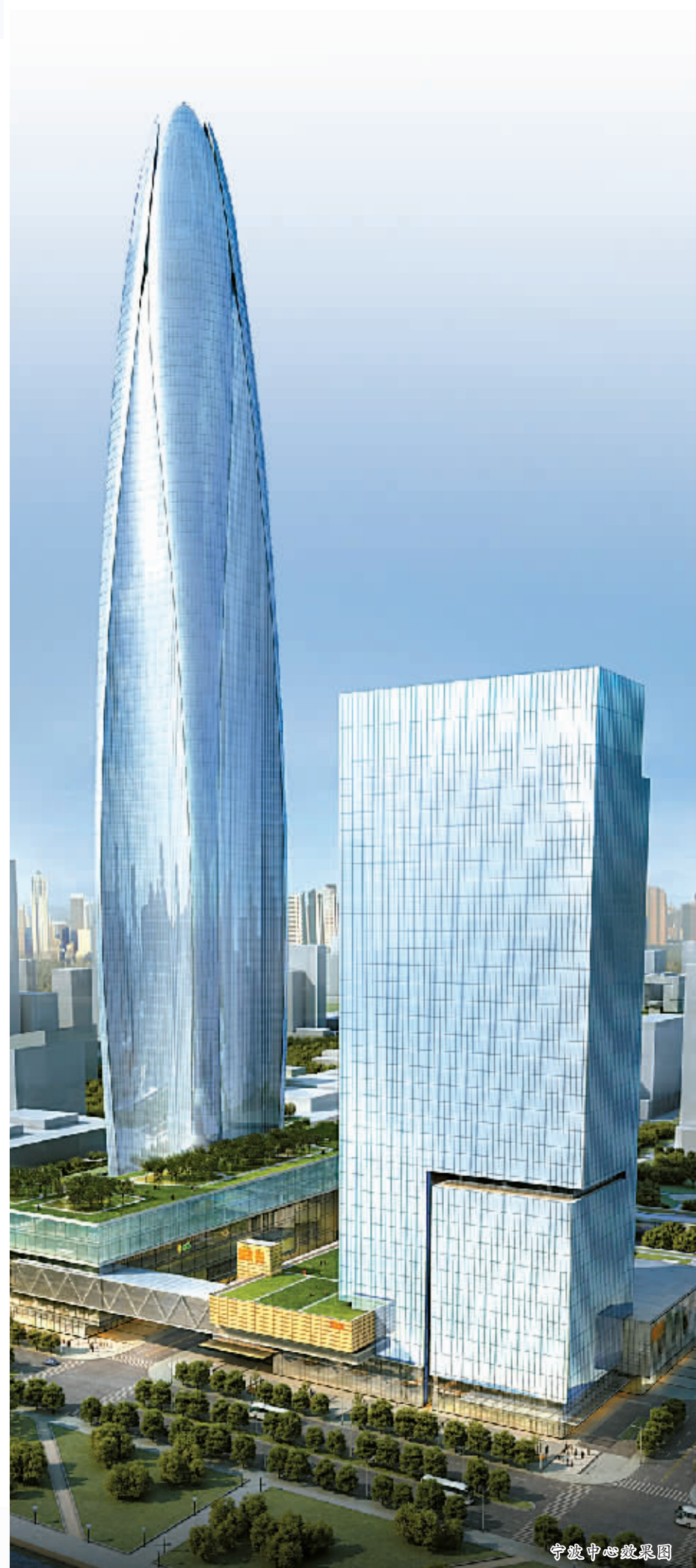
宁波财富中心效果图

项目地处甬江东岸，占地面积约2.5万平方米，设计总建筑面积地上约10万平方米，地下3.8万平方米，建筑高度188米，是目前宁波三江口建筑群中单体规模最大、最高的建筑。