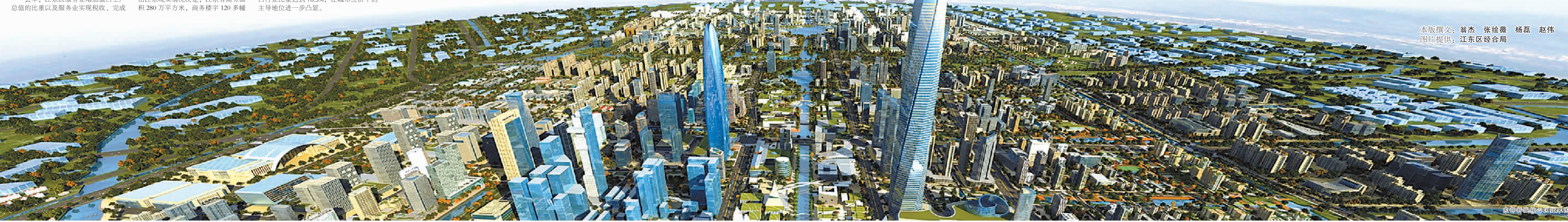
东部新城核心区效果图