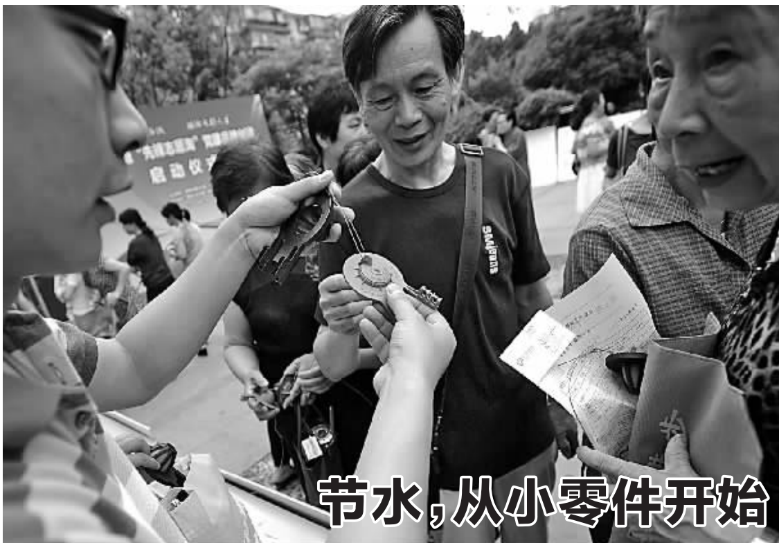
近日,江东区明楼街道举行“先锋志愿淘”品牌创建活动,在现场,志愿者们向辖区居民免费发放马桶节水阀。这种节水装置属于水箱控水零件,能收到明显的节水效果。

日本早稻田大学博士、宁波大学信息学院教师陈杰辉给出建议,大学生创业越来越热,但有激情和热血是不够的,对项目、团队、资金等需要综合考虑。“更理性的创业,才能达到梦想的彼岸。”