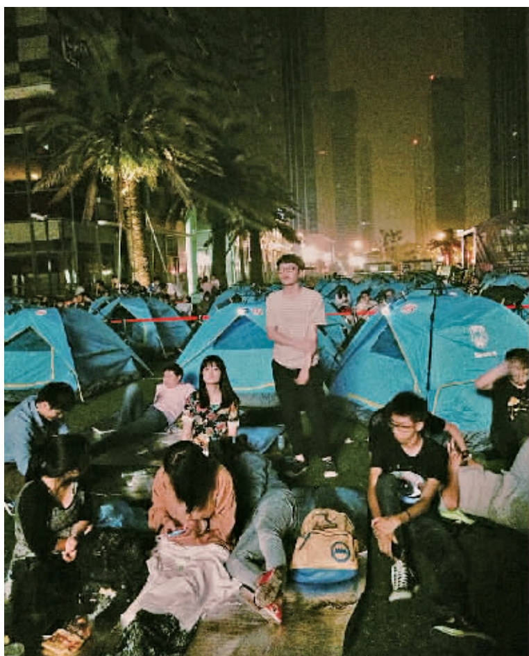
水街上100顶帐篷露营看球成为甬城“世界杯季”的一大风景线。(张正伟 林健 摄)

对吃货来说,世界杯给了一个海喝胡吃的最好理由。江北万达、鄞州印象城等商业广场纷纷举办啤酒节,邀请一众啤酒品牌推出免费试喝、“大胃王”等活动。超市、便利店专为世界推出的啤酒、零