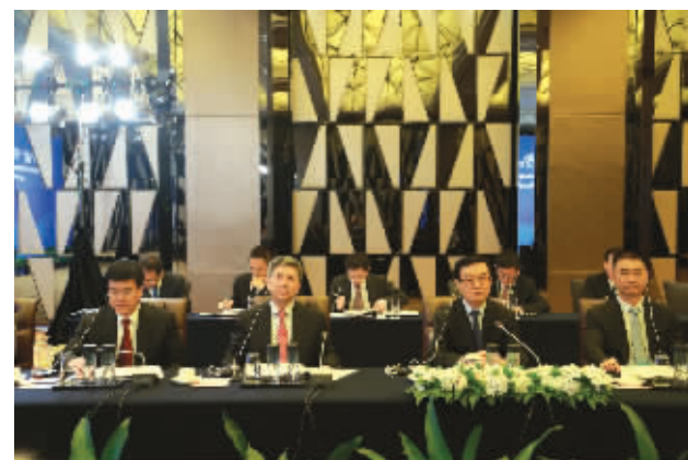
▲商务部部长高虎城(右二)主持双边会议