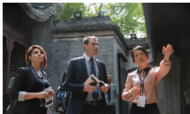
▲会议代表在天一阁