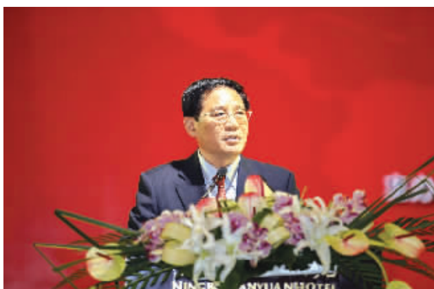
▲省委副书记、省长李强致辞欢迎中外嘉宾