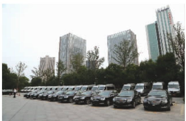
▲宁波本土自主品牌吉利汽车保障会议交通