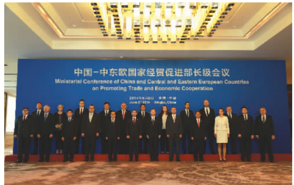
▲国务委员杨洁篪(前排右六)会见十六国代表团团长并合影