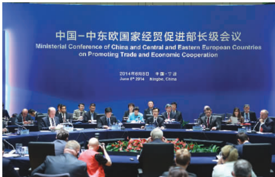
▲部长级会议多边会谈