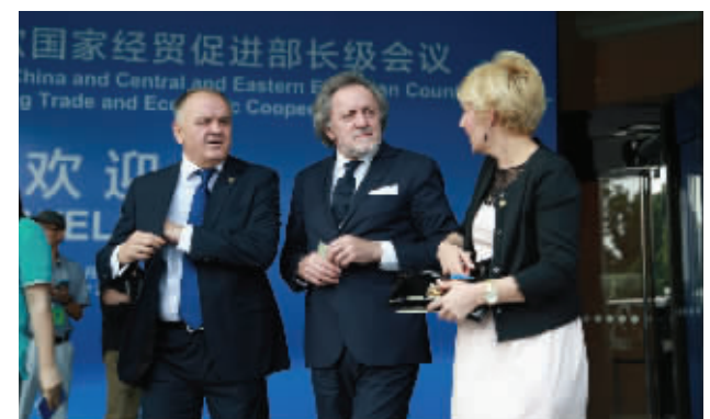
▲会议代表步出会场