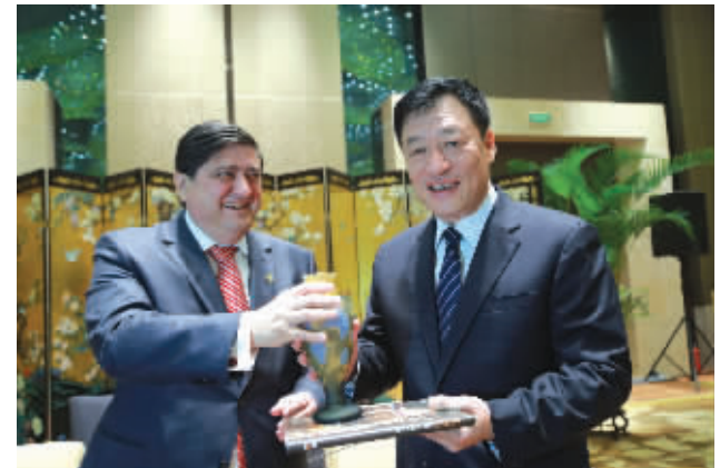
▲省委常委、市委书记刘奇会见罗马尼亚经济部部长康斯坦丁·尼策