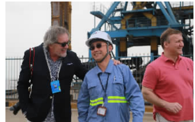
▲会议代表考察宁波港