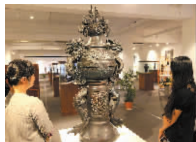
图为展览现场。

本报讯（记者王路）中国当代陶瓷艺术家系列作品开展昨日在市文化馆117艺术中心开展，本次展览从6月18日持续到11月17日，共推出五期陶瓷类艺术家的数百件精品之作。