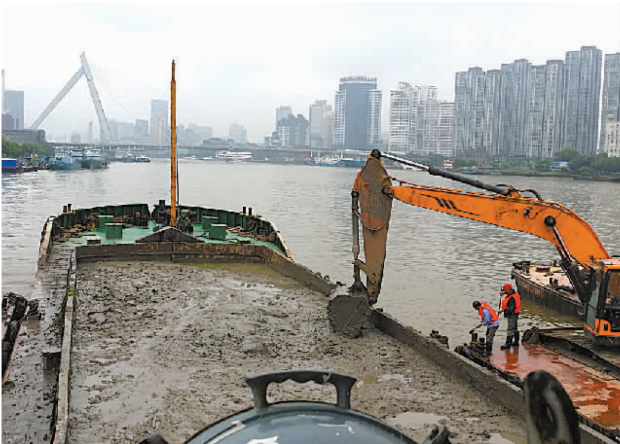
三江口,工作人员正在加紧施工,把翻运出来的淤泥装船运往甬江出海口。

记者还了解到,为了确保零违规倾废,弃土监管采用“人防+技防”相结合的监管方式,建设单位安排专职人员进行技防监控,监理单位24小时监督,加上智能监管系统,确保将弃土运至倾倒区。目前,投入施工的船舶有19艘,日平均清淤土方量约7000立方米。