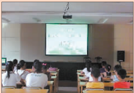
北仑区兴东区域社区服务中心在暑假期间为外来子女开设“阳光课堂”。