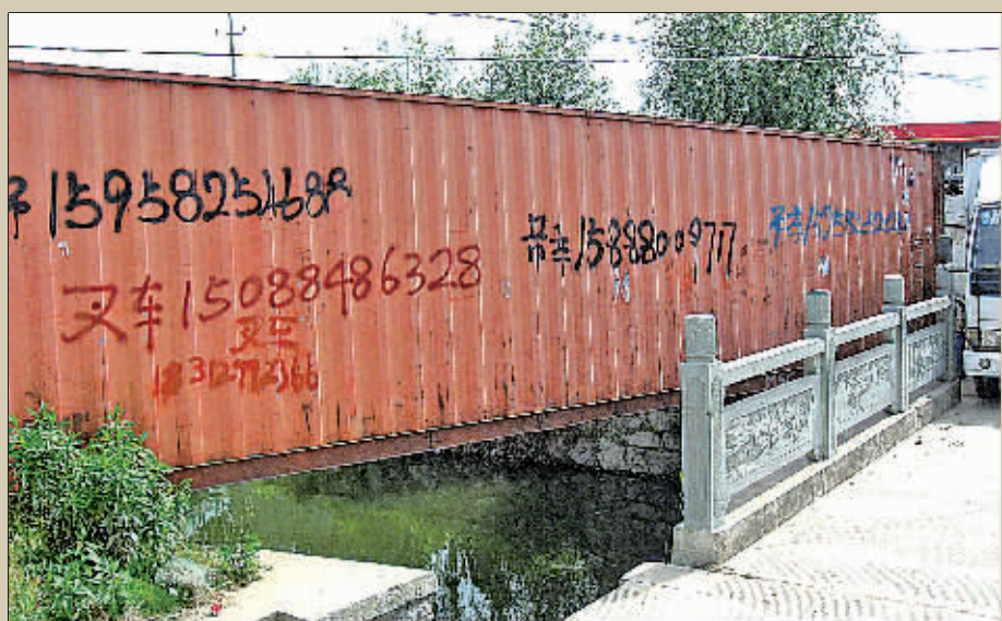
日前,经城管队员上门劝说,横跨在北仑大堰街道富春江南路一条河道上的集装箱“仓库”终于搬家了。据了解,这是附近一家名叫“富春江煤气站”的老板,用来放置空液化气瓶。图为原来横跨在河道两岸的集装箱。