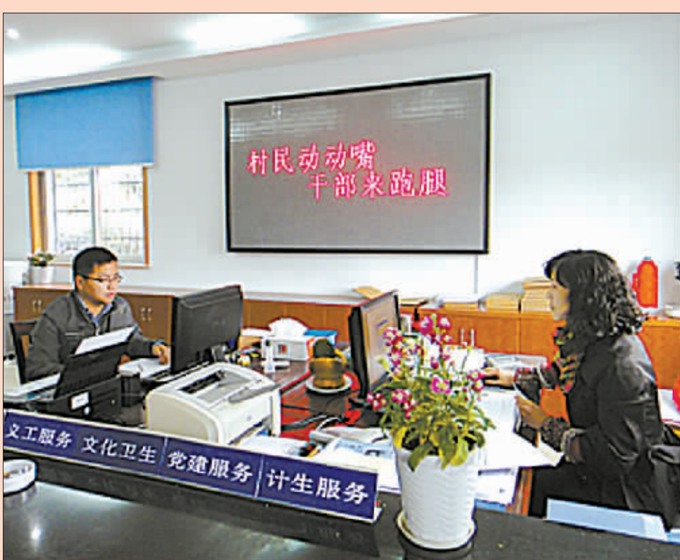
鄞州区上李家村社区服务中心。

近年来,我市逐步完善了农村社区服务功能。按照“便民、为民、利民”原则,大力推动基本公共服务、审批代办服务、信息咨询服务等与农村群众基本生活和保障密切相关的服