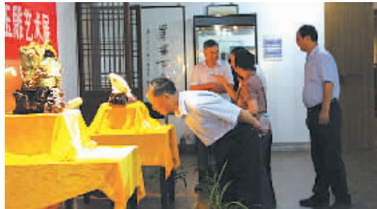
玉雕展。图为观众正在展厅参观。

袁嘉骥生于1954年，是我国杰出的玉雕大师，国家一级工艺美术师，现任湖北省工艺美术研究所副所长。本次展览作品中最能吸引眼球的是袁嘉骥创作的国宝级玉雕作品《佛光照耀》。该作品由一件新疆白玉宝料雕琢而成，佛祖释迦牟尼居中端坐，面容慈善安详，几个憨态可掬的仙童围绕身边，玉石外雕有层峦叠嶂，琼楼玉宇，呈现出一派吉祥和美的景象，是袁嘉骥耗时两年多完成的心血之作。本次展览将持续到6月25日。