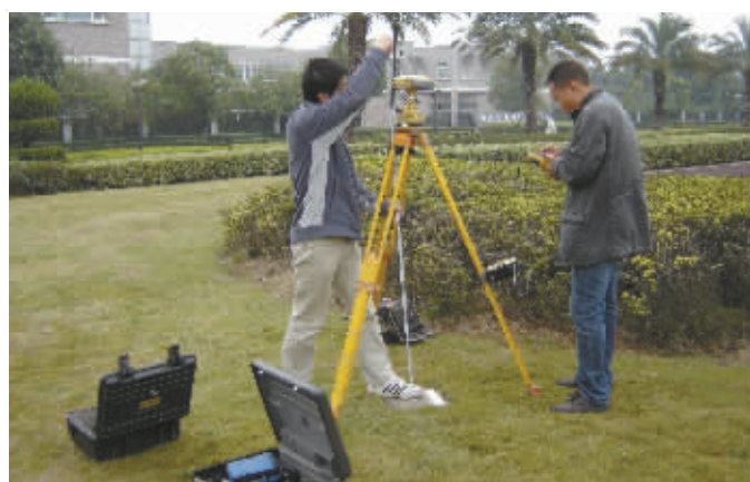
图片均为场外调查场景