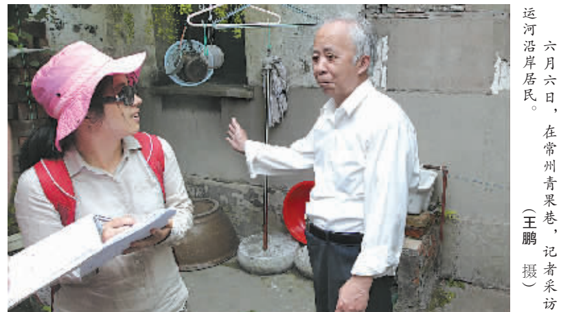
六月六日，在常州青果巷，记者采访运河沿岸居民。

淮安诞生了一代伟人周恩来，《西游记》作者吴承恩、京剧大师周信芳等名人，明清时期因中枢漕运、集散淮盐、漕船制造、粮食储备、河道治理地位显赫而成为“运河之都”。中国漕运博物馆还一直留在我的脑海里。淮安漕运总督署遗址是2002年中国重大考古发现之一，位于总督漕运公署遗址附近的中国漕运博物馆2008年开工建设，现代化的高科技演示与文物史料巧妙结合，全面展示了中国漕运的恢弘历史和灿烂文化，令人叹为观止，尤其是船型超级互动桌充分体现了游客与历史的互动。我想，到博物馆来的孩子们一定非常感兴趣。淮安的戏曲文化土壤肥沃，运河边的广场每天有戏迷唱淮剧等地方戏曲，淮安戏曲博物馆内还有专门场馆供业余戏曲团队表演，宁波籍京剧大师周信芳故居内天天有京剧迷在唱戏。在采访的戏迷中，每个人或多或少总能讲出点运河的故事。