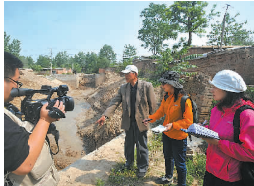
5月9日，记者在聊城市阳谷县周店镇古运河船闸遗址采访当地农民。