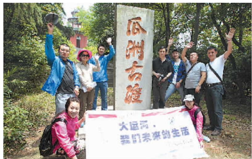
6月5日，采访团在瓜洲古渡合影。

中国大运河成功申遗使宁波有了第一项世界文化遗产，在为宁波骄傲的同时，回想参加“大运河：我们未来的生活”全媒体行动的点点滴滴，也感到非常骄傲。全媒体行动不仅仅走过了27个申遗城市，在运河遗产点、博物馆、文保部门等地采访，寻找中华民族非凡的创造力和大运河深沉而丰厚的底蕴，了解感受当地人民对大运河申遗的热情以及自豪感，也向他们介绍大运河宁波段的重要地位以及宁波当下经济、社会、文化发展。这样的公益宣传活动，是全民寻访中国大运河包容、开放精神内涵的缩影，也是推广宁波城市形象的一次重大策划。参与此次全媒体行动，将成为我植根一生的记忆。