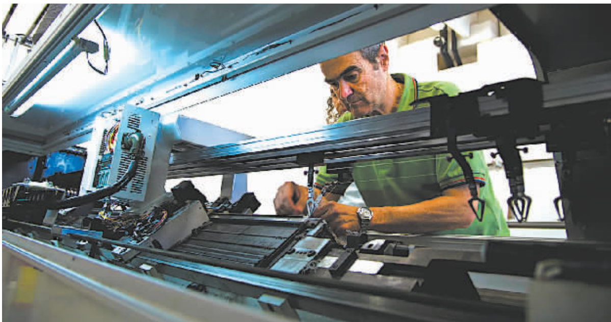
LOGICA软件设计中心内,设计人员正在试用装配了新