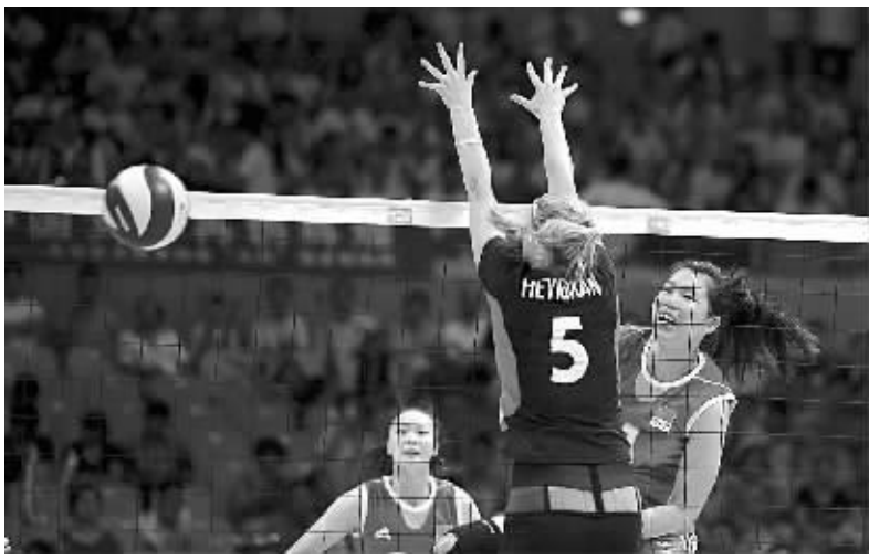
图为比赛中的镜头。