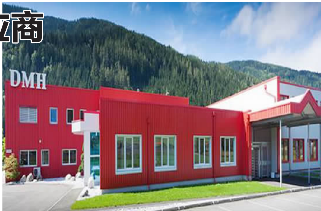
图为奥地利 DMH 公司厂房一瞥。