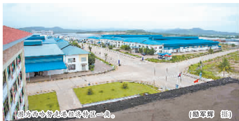
图为西哈努克港经济特区一角。